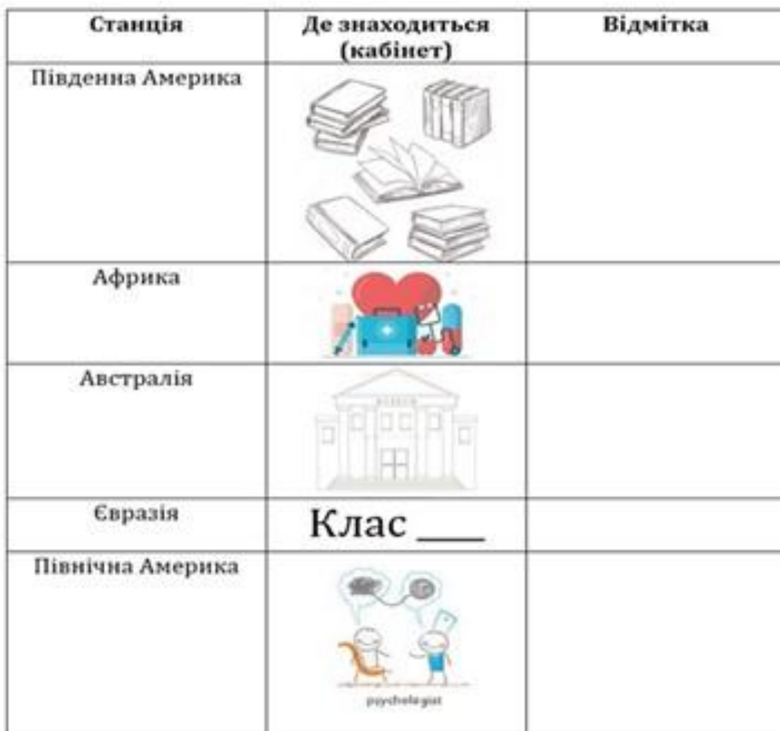
Рис. 1. Крата квесту «Подорож материками»

Після того, як учасники команди розгадають кросворд і назвуть ключове слово ( Земля ), учні отримують конверт із першим фрагментом материка та картою для знаходження наступних станцій квесту. Кожна команда продовжує рух станціями квесту згідно з отриманою картою.