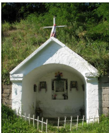
Рис. 2. Капличка

Описувана територія має перевагу ще й у тому, що вона здатна забезпечити жителів питною водою. Тут на відстані 300 м одне від одного відкриваються три великі джерела – нижче першого водоспаду (капличка), напроти Решетюка Івана Дем'яновича (жолоб) і біля Гавінчука Івана Даниловича (прачка).