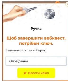
Рис. 2. Фрагмент вебквесту «"Золотий Жук" Едгар Аллан По»

У просторі вебквесту за різними об'єктами захований вихід та підказки з ключами. Учням необхідно пройти всі станції і під час гри зібрати ключі. Для цього варто правильно виконати завдання та ввести відповідь. Вебквест не є обмеженим у часі й у кількості спроб. Якщо трапилася помилка, учні можуть знову натиснути на об'єкт, на якому зупинилися, та продовжити виконання завдання. Мета цієї гри полягає у тому, щоб знайти всі підказки, додаткові ключі та успішно вийти з квест-кімнат.