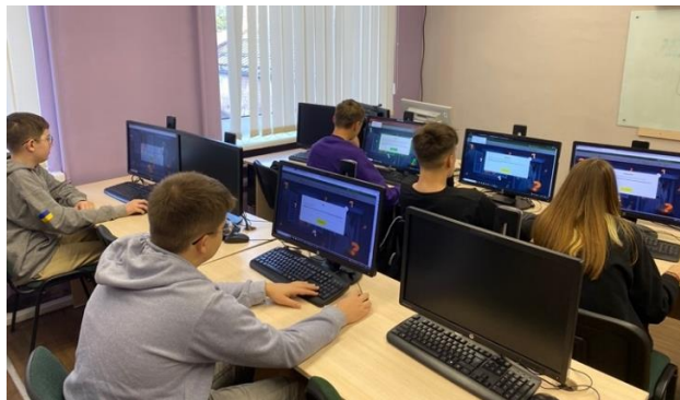
Рис. 3. Виконання вебквесту учнями на уроці

Вебквести на платформі «Всеосвіта» мають зручний механізм для отримання зворотного зв'язку від учнів. Після завершення виконання завдань учнями, є можливість переглянути результати всіх учасників: час витрачений на завдання, кількість правильних відповідей та невдалих спроб. Крім того, після проходження вебквесту учні можуть залишити свої відгуки щодо роботи вчителя. Ці відгуки є важливими при подальшому плануванні роботи з використанням технології вебквестів.