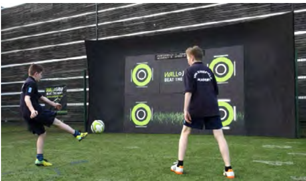
Рис. 8. Тренажерна стінова панель Walljam

Тренажерну стінову панель Walljam (рис. 8) можна використовувати як у приміщенні, так і на свіжому повітрі для поліпшення техніки гри у футбол, відпрацювання точності влучань м'яча. Панель обладнана світлодіодним екраном, виконує функцію і тренера, і суперника, і товариша по команді, надає можливість порівнювати індивідуальні досягнення гравців через онлайн ліги, аналізували силу ударів, точність влучань та загальної продуктивності.