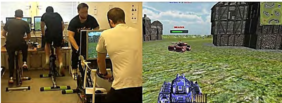
Рис. 3. Рухова активність із використанням Pedal Tanks

вати і відтворювати рухи тіла гравця. Застосовуючи “Motion Capture” (рис. 2), голова, руки, ноги, тулуб гравця стають засобами управління грою. Учасники гри можуть бачити свої віртуальні образи на екрані та взаємодіяти з іншими персонажами, отримувати поради тренера і збільшувати фізичну активність.