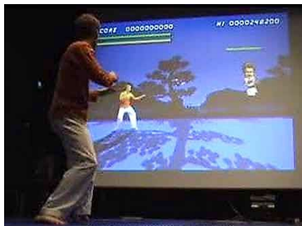
Рис. 6. Рухова активність під час гри Kick Ass Kung-fu

Слід звернути увагу на гру Kick Ass Kung-fu (рис. 6), котра вимагає рухів усім тілом, які відображаються на ігровому полі. Відсутність реального контакту з віртуальним суперником сприяє вивченню таких рухів і вправ, які є надто ризикованими у реальному двобої чи спарингу.