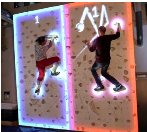
Рис. 9. Ігрова платформа для скелелазіння Augmented Climbing Wall

Для тих, хто захоплюється скелелазанням, існує ігрова платформа Augmented Climbing Wall (рис. 9), що призначена для людей різного віку і сприяє не тільки вдосконаленню техніки, а й розвитку витривалості й силових якостей. Обладнання дає можливість змінювати кути і контролювати швидкість підйому на стінку, чергувати кардіотренування на більш простих кутах, а м'язове – на крутіших.