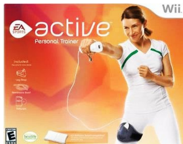
Рис. 7. Ігрова платформа EA Sports Active

Комбінувати ігрову діяльність із виконанням загальнорозвиваючих вправ можна завдяки платформі EA Sports Active (рис. 7), при чому інтенсивність навчання тут відповідає інтенсивності ходьби на біговій доріжці.