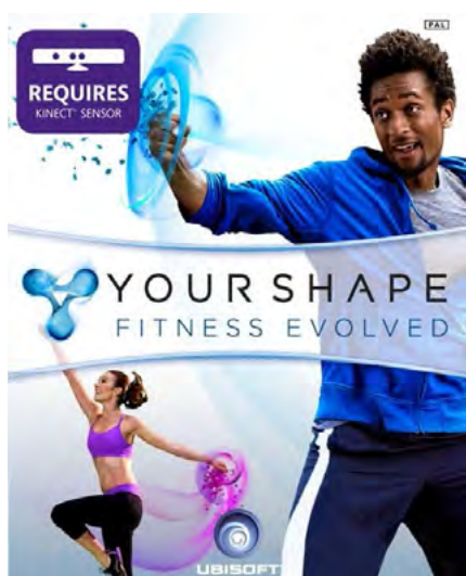
Рис. 5. Віртуальні заняття на платформі Your Shape Fitness

Різні режими дають змогу займатися з особистим «віртуальним» тренером або просто розважатися. Your Shape Fitness (рис. 5) дає можливість відтворити на екрані аватар користувача і сприяє вивченню танцювальних рухів, вправ з аеробіки, йоги.