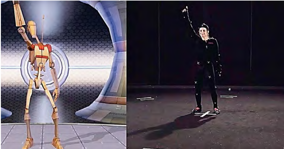
Рис. 2. Рухова діяльність із застосуванням Motion Capture