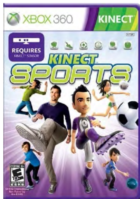
Рис. 4. Ігрова платформа Kinect Sport

Дослідження свідчать, що інтенсивність тренувань під час цих ігор є співвідносною традиційному навантаженню, поліпшується розвиток швидкісних, силових і координаційних якостей, швидкості реакції і точності рухів, а то й просто відбувається навчання їзди на велосипеді [21; 22].