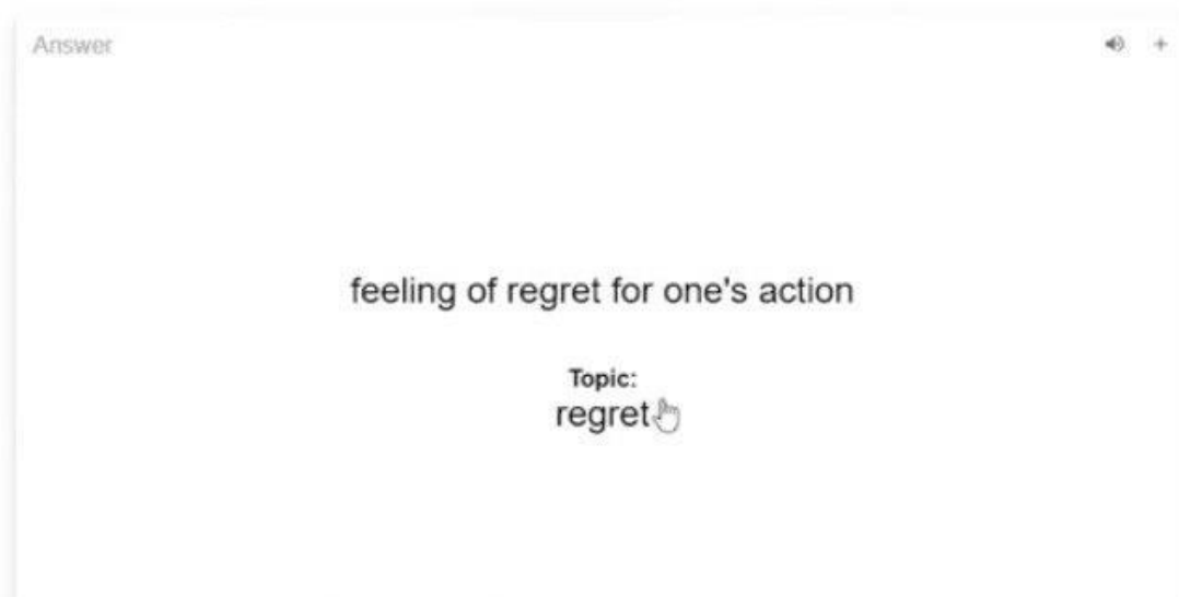
Рисунок 2. The Flashcard Lab