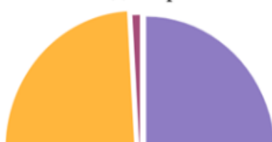
Способи перекладу стилістичних фігур у вітальних промовах Володимира Зеленського