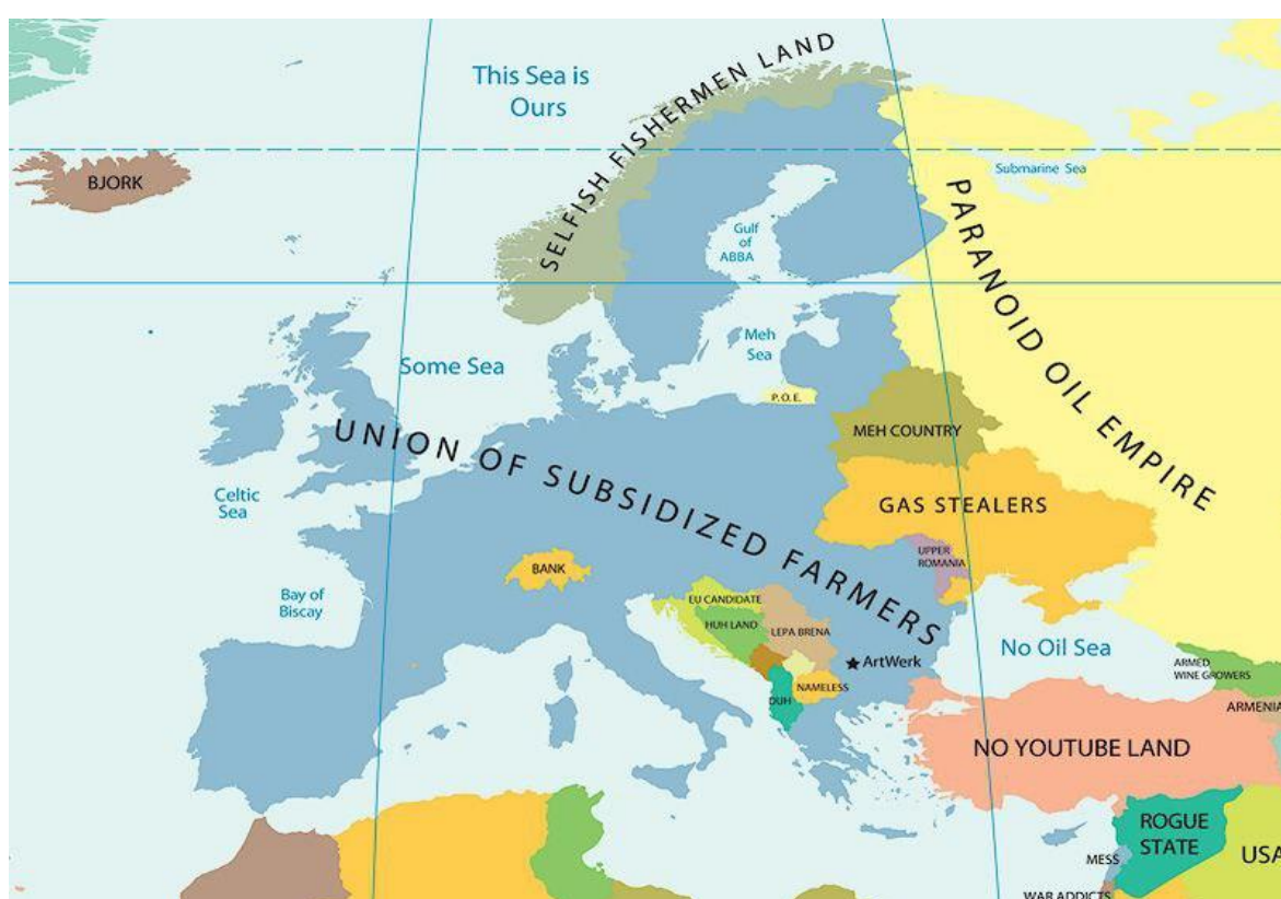
Рисунок 1. Карта з «Атлас стереотипів та упереджень»

Болгарський художник Янко Цветков зобразив серію карт світу, що відображають різноманітні національні стереотипи. До створення даних ілюстрацій його спонукали ситуації, коли він намагався пояснити специфіку менталітету різних народів своїм іноземним друзям. Пізніше на основі цих ілюстрацій він створив «Атлас стереотипів та упереджень».