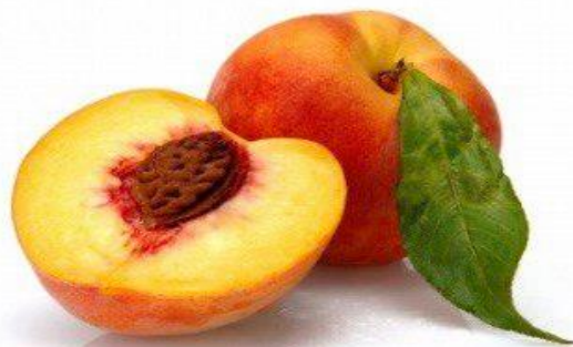
Рисунок 1. Quizlet