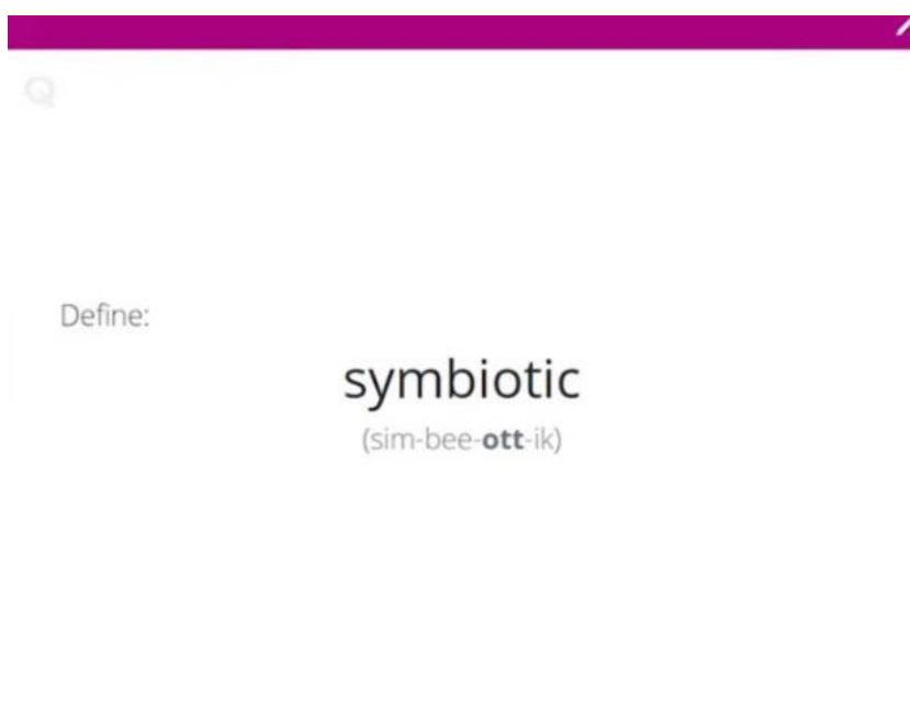
Рисунок 3. Brainscape Flashcards

Brainscape Flashcards is a flashcard platform for Android and iOS that allows users to create their own digital flashcards and view ready-made collections created by other students and teachers. The app contains many flashcards on various topics, including languages, literature, history, science, math, and more.