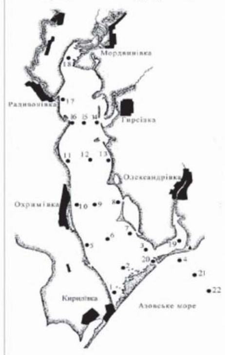
Рис. 1. Пункти збору даних в Молочному лимані

В основу публікації покладені матеріали звітів кафедри зоології Мелітопольського пединституту за 50–90 роки минулого століття, а також матеріали, зібрані авторами в Молочному лимані за період 1996–2010 рр. (рис. 1).