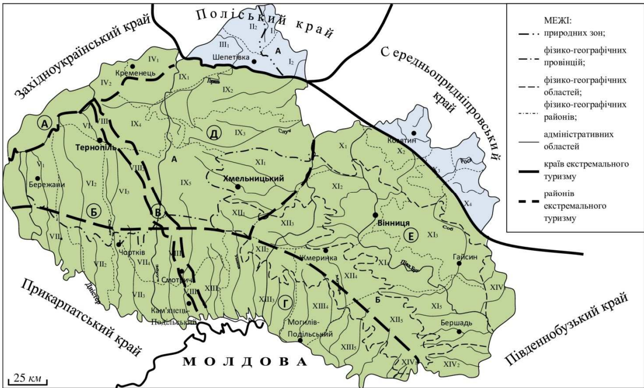
Рис. 2. Районування екстремального туризму на основі фізико-географічного районування Поділля