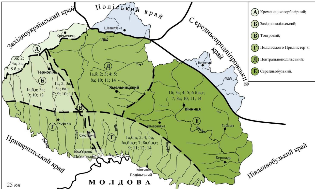
Рис. 3. Просторовий розвиток окремих видів туризму у межах Поділля

Розглянемо схему районування екстремального туризму у межах Поділля у відповідності із зазначеними вимогами до його організації (рис. 3). За О.В. Колотухою візитною картою Поділля є спелеологічні туристичні ресурси, максимальна категорія складності яких – III. Схилами Подільської височини можна прокласти велотуристичні маршрути II категорії складності, автомаршрути II категорії складності. Річки Поділля оцінені II категорією складності – р. Південний Буг від Меджибожа до Гайворона, р. Смотрич, р. Збруч. Першою категорією складності оцінюються пішохідні, лижні та вітрильні (Бузькі водосховища) туристичні маршрути [12, с. 265-266]. З цією попередньо узагальненою характеристикою Поділля, як туристично-спортивного підрайону, частково можна погодитись.