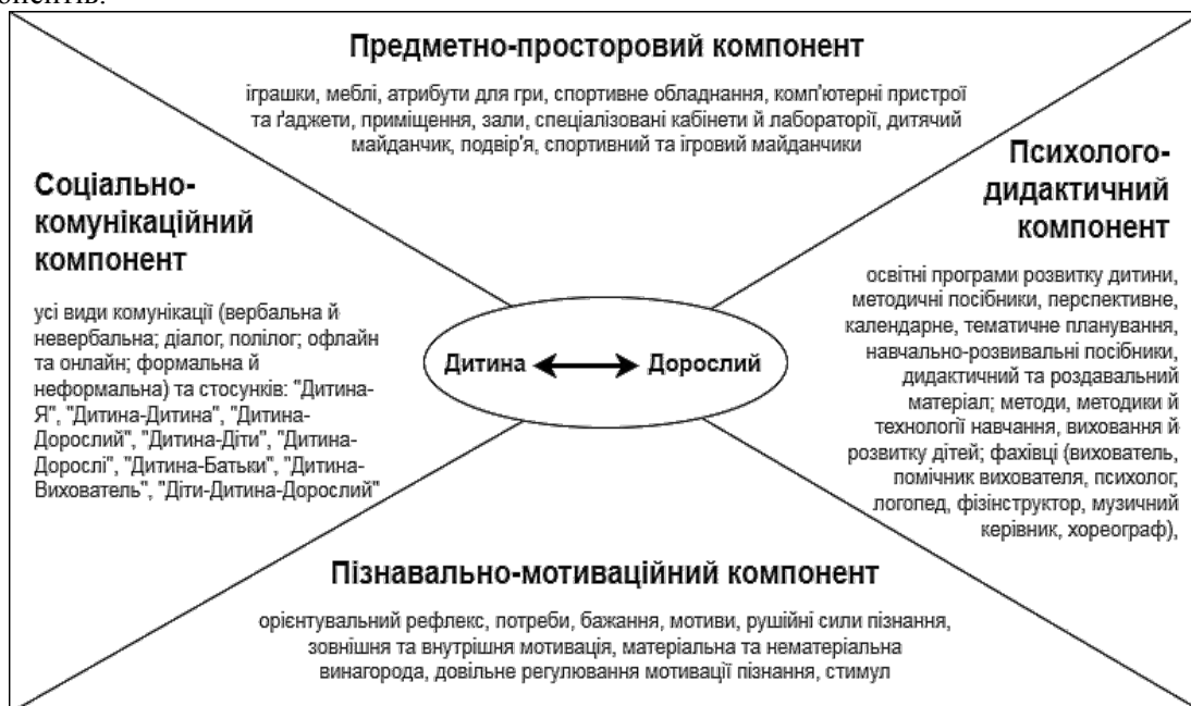
Рис. 2. Структурні компоненти предметно-ігрового середовища ЗДО

Засвоєння теоретичних основ структури предметно-ігрового середовища ЗДО відбувається шляхом створення здобувачами вищої освіти структурно-логічної схеми (рис. 2), у центрі якої – дитина та дорослий (педагог, батьки) як суб'єкти освітнього процесу, оскільки активне пізнання світу дитиною здійснюється через спільну діяльність з дорослим. Чотири частини, що відображені на рис. 2, відповідають компонентам структури предметно-ігрового середовища. В них окреслено зміст і смислові акценти характеристики кожного зі структурних компонентів.