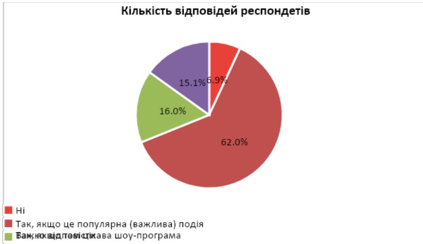
Рис. 3. Результат відповідей респондентів на запитання «Чи погодилися б Ви оплатити вхід на спортивний захід?»

На думку респондентів, найважливішими факторами, які впливають на популярність спортивного заходу (окрім реклами) є статус змагань, який включає кількість учасників, рівень організації та інше, а також комфортні та безпечні умови перегляду, так вважають 52,4% та 22,9% опитаних відповідно. Варто зазначити, що в гендерному розрізі існують певні особливості, так жінки надають більшого значення ніж чоловіки комфортним та безпечним умовам для відвідувачів, наприклад, зручність місць для перегляду, наявність фуд-кортів, місць для паркування тощо. Порівняльний аналіз відповідей чоловік і жінок показаний на рис.4.