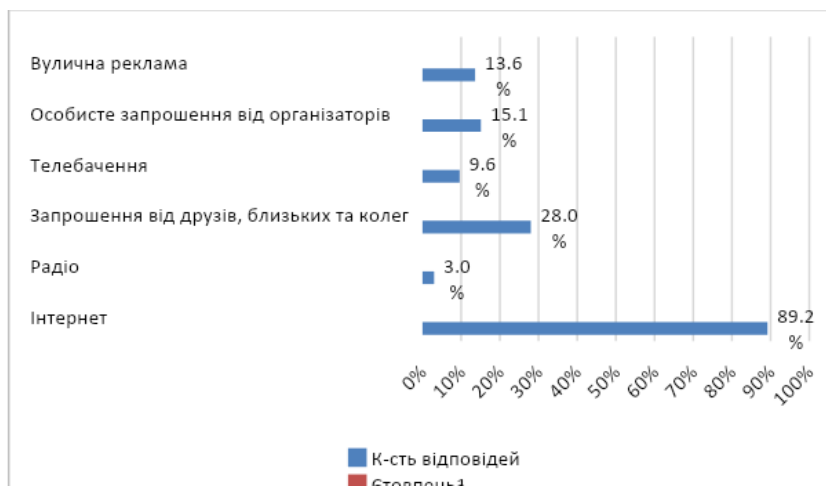
Рис.2. Результати відповідей респондентів на запитання «Зазвичай Ви дізнаєтеся про спортивні події через?»

ефективними засобами комунікацій з метою інформування населення про спортивні події є Інтернет, включаючи соціальні мережі та блогерів, також важливими є особисті комунікації (запрошення від друзів, близьких чи колег), що показано на рис. 2.