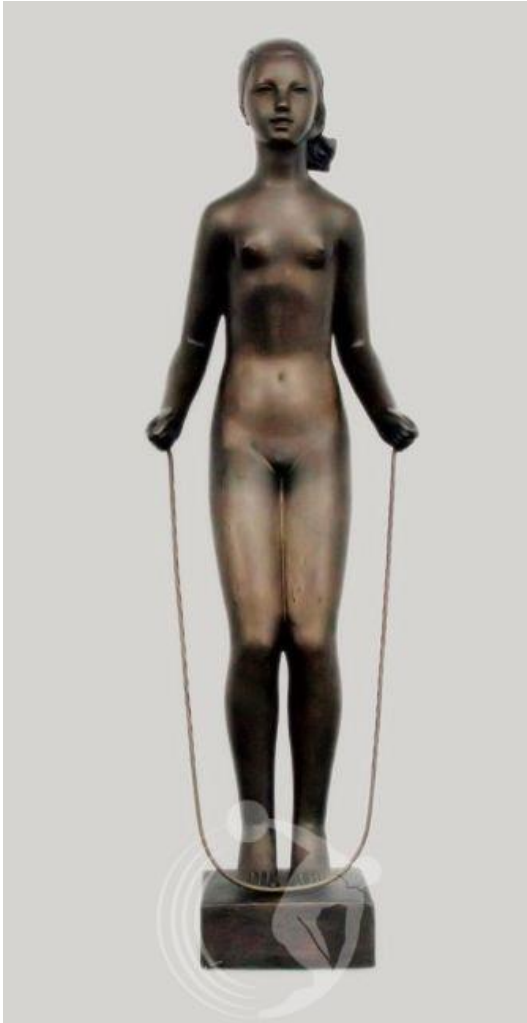
Фото 1. Дівчина зі скакалкою (1931 р.). Авт.: Альфонс Карни. Матеріал: бронза, висота 130 см. І нагорода в Крайовому олімпійському конкурсі мистецтв (1932 р.), Нагорода м. Варшави (1935 р.), Велика почесна спортивна нагорода державного управління з фізичної культури і військової підготовки.

в 1920 році першої в Польщі кафедри графіки у Варшавській академії мистецтв.