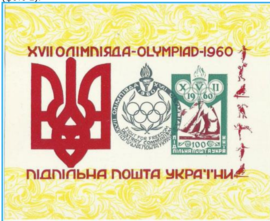
Фото 2. Підпільна поштова марка України, присвячена XVII Олімпіаді.

В Польщі, як і в багатьох країнах світу, широкого розповсюдження набула філателія з олімпійської тематики (вперше поштові марки до Олімпійських ігор вийшли в США у 1932 р.). Починаючи з радянських часів (1952 р.) в Україні «Підпільна пошта» випускала в світ марки та поштові блоки (фото 2).