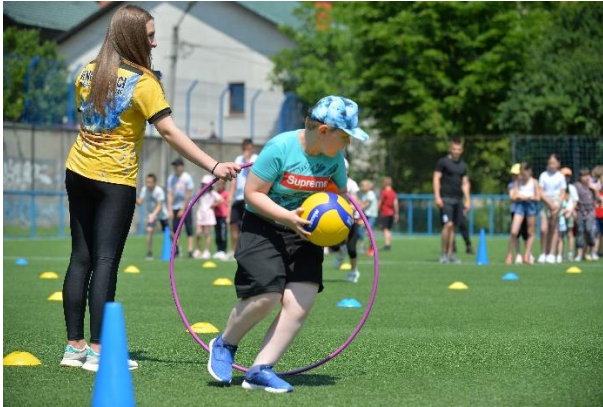
Рис. 2. Фізкультурно-рекреаційні та освітні заходи для дітей, школярів та ВПО

Шляхом заохочення дітей до занять фізичною культурою і спортом відбувається підвищення їхньої рухової активності, що допомагає повернутися до повсякденного життя і позбутися стресу, набутого в сучасних умовах.