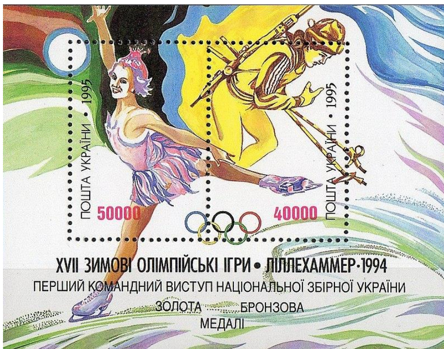
Фото 3. Поштова мініатюра (1996 р.), присвячена українській фігуристці Оксані Баюл (перша олімпійська чемпіонка часів вільної України) і біатлоністці Валентині Цербе-Несін (бронзова медаль-перша олімпійська нагорода незалежної України).

Доречно нагадати, що на час проведення Олімпійських ігор стародавності припинялися всі наявні воєнні конфлікти (угода 776 р. до нашої ери між Еладою і Спартою). В 100-ліття (6.06.1994 р.) з дня проведення установчого Конгресу в Сорбонському університеті по відновленню Олімпійських ігор голова Івано-Франківської студентської спортивної спілки проф. Богдан Мицкан звернувся з листом до Президента НОК України Валерія Борзова про таке: цитата «Враховуючи важливе значення спорту в найрізноманітніших сферах життя планети (політика, наука, культура, архітектура тощо) ми просимо НОК України ввійти з клопотанням до МОК про необхідність прийняття звернення до ООН щодо оголошення 1994 року роком «Олімпійського спорту», а також проведення під егідою ООН світового конгресу «О спорт, ти мир» за участю керівників держав по підготовці і підписанню угоди «Про обов'язкову дотримання миру під час проведення Олімпійських