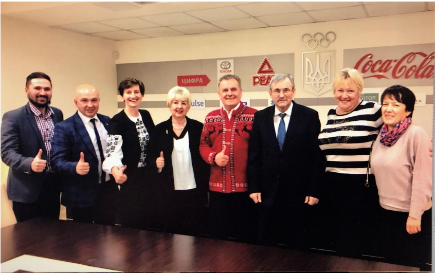
Засідання комісії НОК України «Закордонне українство». Київ, офіс НОК України, 28.11.2019 р.