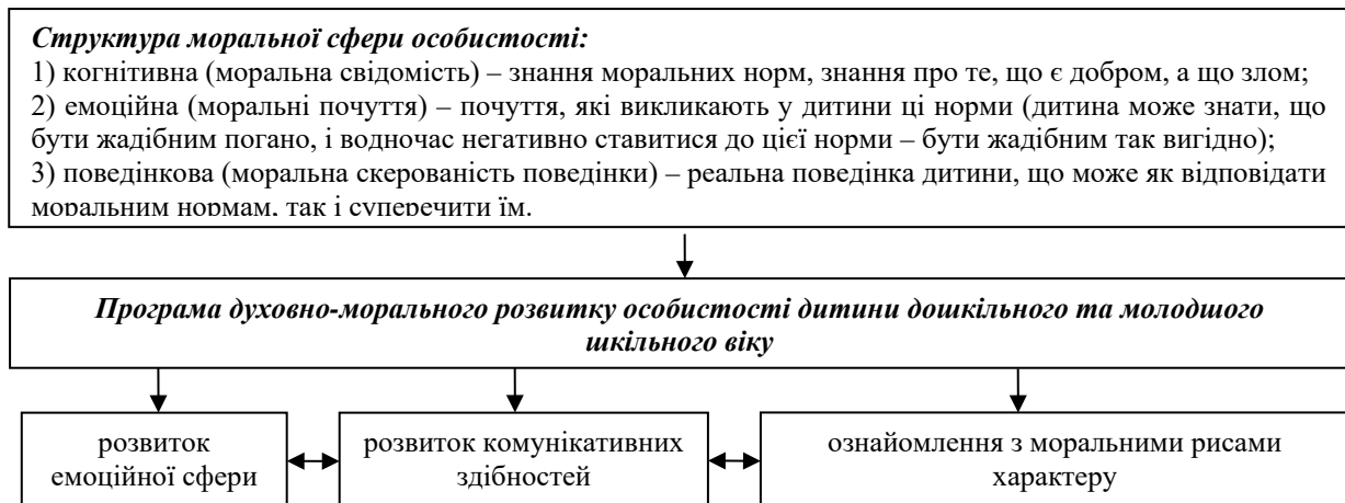
Рис. 2. Програма духовно-морального розвитку особистості дитини дошкільного та молодшого шкільного віку

Педагоги повинні сформувати програму психологічних занять із дітьми дошкільного та молодшого шкільного віку, що скерована на духовно-моральний розвиток та яка повинна містити вищі здобутки народної мудрості, котрі закодовані в змісті казок, притч, оповідань, ігор тощо (рис. 2).