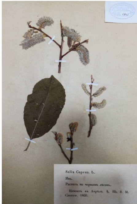
Salix caprea L., 1960 p.

Гербарні збори іменної колекції відомого науковця В. М. Черняєва, які були віднайдені у фондах гербарію (UM), характеризуються як раніше невідомими в Україні і більшість їх збережені у гербаріях Києва (KW) та Харкові (CWU). Опрацьовані гербарні зразки дозволять доповнити цей перелік і гербарієм УНУС (UM).