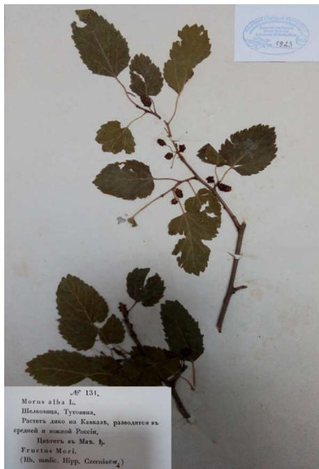
Morus alba L.