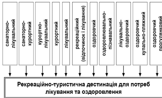
Рис.2. Види туризму і РТДе для потреб лікування та оздоровлення [2]