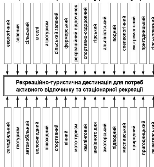
Рис. 1. Види туризму і РТДе для потреб активного відпочинку та стаціонарної рекреації [2]

Окрім названих видів туризму, приурочених до певного типу РТДе, існують види туризму, що не вписуються у запропоновану класифікацію. Серед них науковий; навчальний або навчальні тури; діловий або економічний; конгресний; промисловий; індустріальний; екзотичний; біологічний; гастрономічний; винний; сиро-винний; туризм VIP (елітарний); соціальний; туризм одиноких сердець; секс-туризм; шоп-туризм чи шопінговий; прикордонний; хобі-туризм; дипломатичний; майданний; сентиментальний; віртуальний; стаціонарний; альтернативний, волонтерський, туризм внутрішньо переміщених осіб тощо.