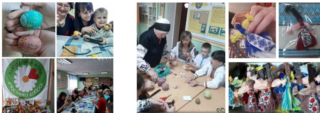
Рис. 3 Проведення майстер-класів в музеї

«Просвіта» принесе корисні плоди у формуванні почуття гордості за нашу державу.