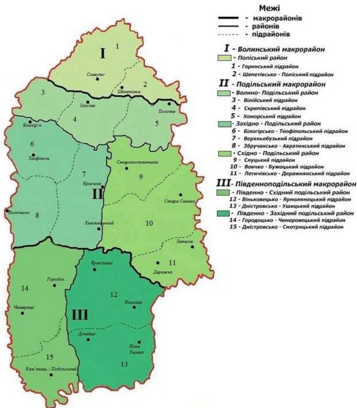
Рис.3. Схема топонімічного районування Хмельницької області

В рамках декомунізації Верховна Рада ухвалила постанову №4084 про перейменування 152 сіл, селищ та міст України, серед них 17 сіл з Хмельницької області. В Шепетівському районі перейменовували 2 населені пункти: с. Улянівка - с. Гаврилівка; с. Радгоспне - с. Радісне. У Кам'янець-Подільському районі перейменовано 4 населені пункти: с. Петрівське - с. Балинівка; с. Жовтневе - с. Мукша Китайгородська; с. Ленінське - с. Вишневе; с. Комунар - с. Загородське. У Хмельницькому районі перейменовано 11 населених пунктів: с. Жовтневе - с. Лісове; с. Радянське - с. Іванківці; с. Петрівське - с. Бутівці; с. Петрівське - с. Хутір Дашківський;