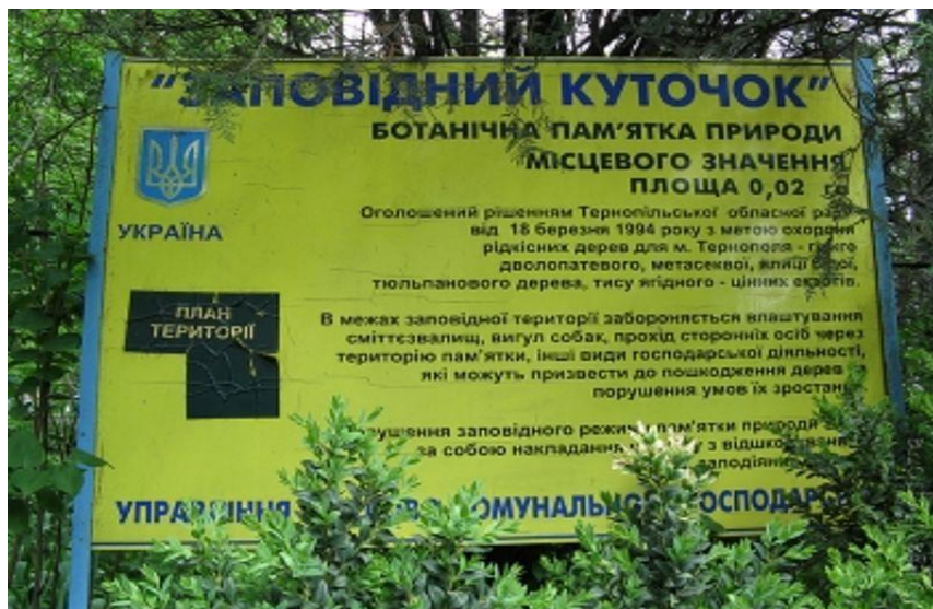
Рис 3. «Заповідний куточок імені Миколи Петровича Чайковського»

Відомі на всю Україну ботанічні заказники державного значення в околицях м. Заліщики (Обіжево, Жижава, Криве, Касперівський ) - заслуга цього чоловіка. Пізніше вчений взяв участь у процесі визнання заповідниками державного значення урочища Глоди біля Колодрібки, урочища Заліщицька діброва біля Шутроминців та кількох десятків заповідних об'єктів місцевого значення. Природо-заповідний фонд Тернопільського району станом на 2004 рік налічував 62 об'єкти. Більшість з них отримали свій охоронний статус саме завдяки праці М.Чайковського.