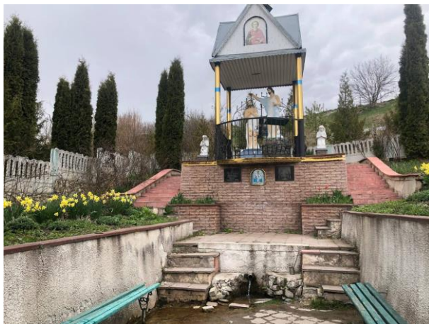
Рис. 3. Джерело «Святої Трійці» станом на 18.04.2022

декоративною бетонною плиткою, спускаючись по них нижче, ми потрапляємо струмка, також навпроти джерела вмонтовані дві дерев'яні лави, біля них висаджені нарциси, тюльпани, троянди та інші квіти (рис. 3).