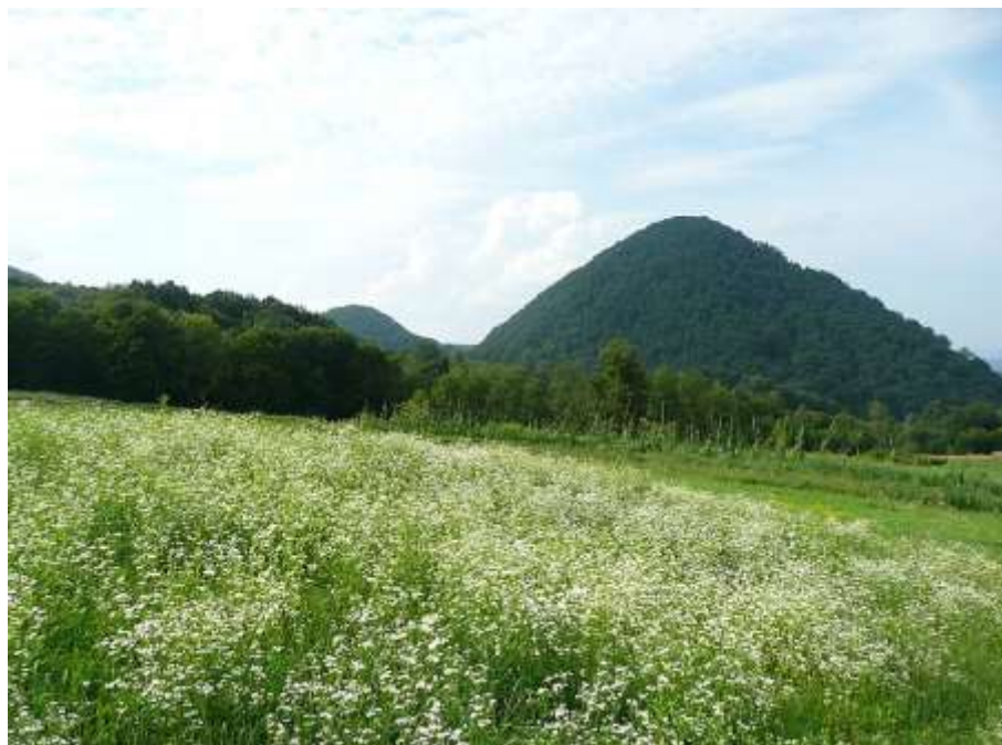
Рис. 2. Красвиди Шаяну [ https://upload.wikimedia.org/wikipedia/commons/thumb/6/69/Shayan2.jpg/800px-Shayan2.jpg ]