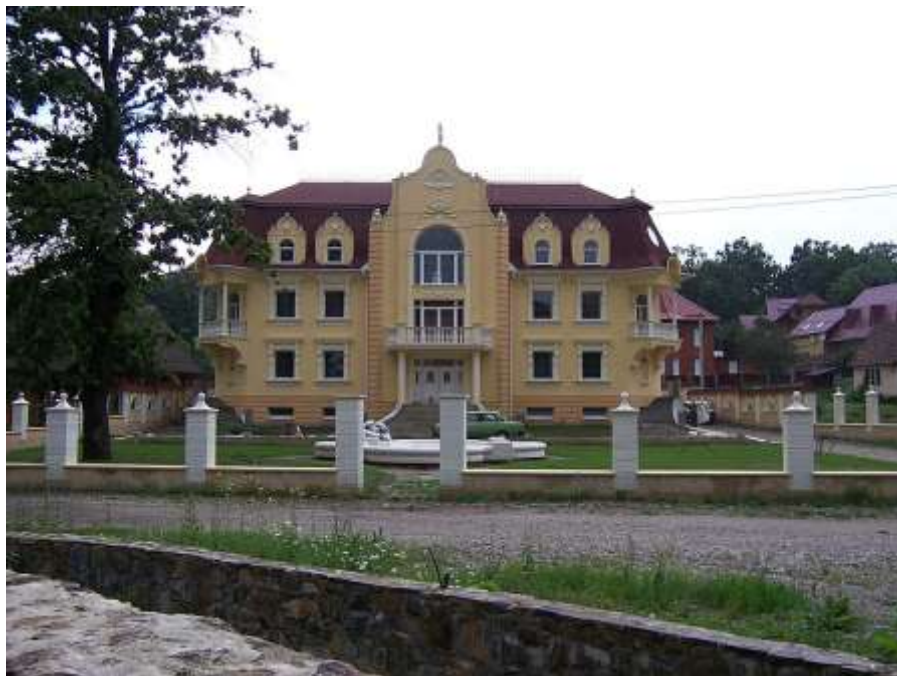
Рис. 3. Курортна зона

[ https://upload.wikimedia.org/wikipedia/commons/thumb/2/25/Shajn3.JPG/800px-Shajn3.JPG ]