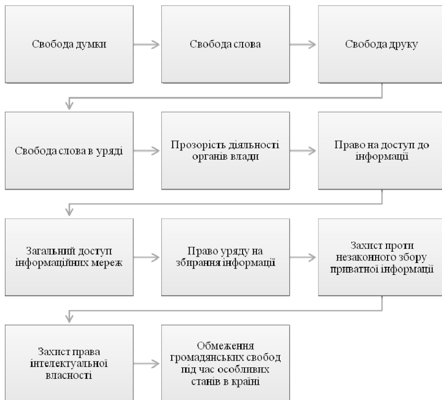
Рис. 2. Базові принципи інформаційної політики США

У той же час, концепція національної інформаційної політики США ставить завдання розширення і вдосконалення інформаційного простору, посилення свого впливу в таких регіонах, як Латинська Америка, Центральна і Східна Європа, країни Арабського світу та Азійсько-Тихоокеанського регіону. США запропонували доктрину “інформаційної парасольки” міжнародного співробітництва з широким колом країн у різних регіонах світу, суть якої у превентивній комунікації на основі переміщення масивів інформації, що передається США державам-реципієнтам для забезпечення їх національних інтересів і, як наслідок, збереження лідерства США в політичній системі міжнародних відносин.