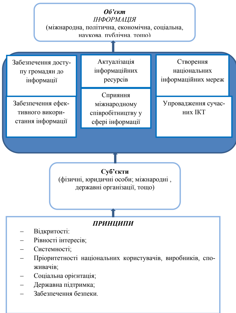
Рис. 1. Узагальнена модель державної інформаційної політики

У своїй праці [4, с. 8] В. Пожуєв детально розкриває базові принципи інформаційної політики, але не приділяє уваги негативним аспектам цього феномену [9, с. 8]. Проте професор С. Браман окрім традиційного визначення поняття “інформаційна політика” розкриває його негативні характеристики через аналіз такого феномену нового тисячоліття як інформаційна держава. Зокрема, вона виділяє наступні соціальні впливи нових тенденцій інформаційної політики в інформаційній державі: