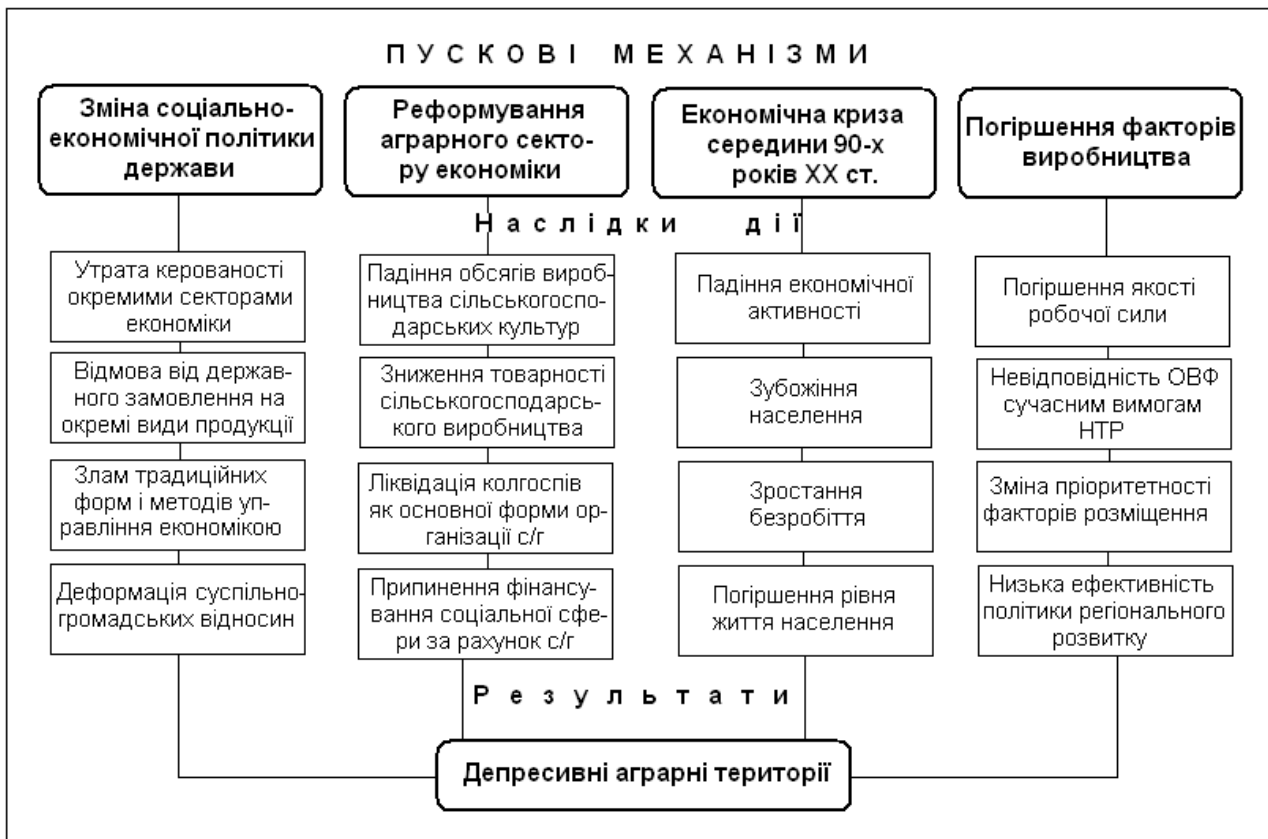
Рис. 1. Механізми формування депресивних аграрних територій

На думку М.І. Долішнього, “Найголовнішим фактором формування негативних тенденцій у розвитку господарського комплексу України та економіки окремих її регіонів стала деформація суспільно-господарських відносин, що мало місце у соціально-економічних процесах та в переважній більшості сфер діяльності практично всіх верств населення [12, С.491]. Перехід від традиційної, упродовж багатьох років командно-адміністративної системи, до ринкових методів господарювання у 90-роках ХХ ст., позначився на розвитку усіх сфер людської діяльності. При відсутності чіткої позиції у “центрі”, регіональні еліти виявилися у скрутному становищі. Глибина регіональних депресій значною мірою визначалася особливостями галузевої структури економіки та спроможністю регіональної влади запобігти руйнівним соціально-економічним процесам. У найскрутнішій ситуації виявилися аграрно-індустріальні регіони, де основою економічного потенціалу були сільське господарство, машинобудування та легка промисловість. У 1999 р. обсяги виробництва сільськогосподарської продукції в Україні становили лише 48,7 % рівня 1990 р., у 2000 р. – 53,4 %. Найбільший спад сільськогосподарського виробництва спостерігався в Волинській, Закарпатській, Івано-Франківській, Рівненській та Чернівецькій областях.