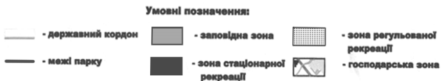
Рис. 2 Попереднє функціональне зонування НПП “Прип’ять-Стохід”