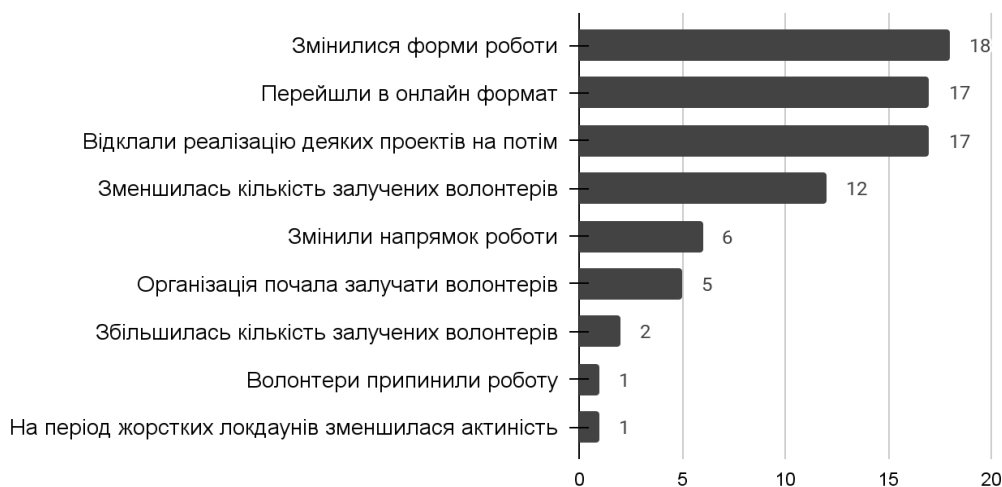
Рисунок 2. Зміни, які відбулися в волонтерських організаціях у зв'язку з введенням карантинних заходів ( N = 35 )

На діаграмі (рис. 2) можна побачити, яких змін зазнала робота волонтерських організацій під час карантину.