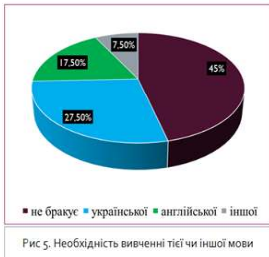
Рис 5. Необхідність вивчення тієї чи іншої мови