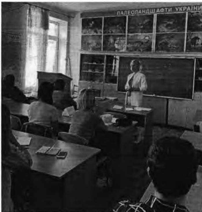
Магістрантка географічного факультету під час науково-педагогічної практики

Введення карантину стало серйозним викликом щодо забезпечення неперервності освітнього процесу. Спільні зусилля та злагоджена робота всіх підрозділів університету дозволяють організовувати та ефективно проводити як всі види практик так і навчальний процес взагалі.