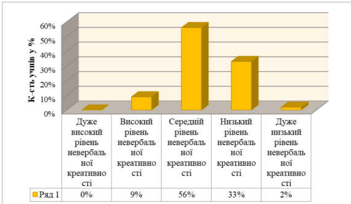
Рис.1 Відсоткове співвідношення рівнів розвитку невербальної креативності молодших школярів

Зупинимося на аналізі результатів за методикою діагностики невербальної креативності Е. П. Торренса (рис. 1). Як бачимо, отримані в ході дослідження дані вказують на переважно середній рівень розвитку невербальної креативності у більшості учнів класів. Співвідношення результатів дослідження креативності у молодших школярів за цією методикою, показало, що найкращим чином у них сформована швидкість (40%), далі йдуть гнучкість (35%), унікальність (33%). Трохи нижчі результати ми отримали за показником оригінальності (22%), критерієм розробленості (23%) та «Абстрактністю назви» (12%). Порівнявши рівень розвитку невербальної креативності у хлопчиків та дівчаток, ми дослідили, що з усієї вибірки високий рівень невербальної креативності мають 18% хлопців і 13% дівчат, але показник оригінальності виявився вищим у дівчат і становить 28%, тоді як в хлопців - 16%.