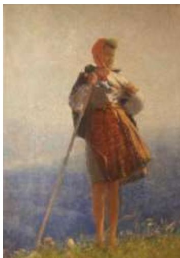
Рис. 1. М. Бездільний. Верховинка. 1964. Полотно, олія.

У картині «Верби над річкою» (1978) можемо спостерігати аналог класичного живописного прийому. І сам сюжет також традиційний, він часто проглядається у класиків українського живопису, зокрема в етюдах С. Світославського. Заплати річки у роботі «Вечірня тиша» (1975) відсилають до неперевершеного С. Васильківського (Рис. 2). Але тут вечір вже бережанський, виразно місцевий, рідний художнику. У ліричних мотивах пейзажів із водоймами Бездільний захоплювався відображенням у них вечірнього неба, рослинності, легким полиском дрібних хвиль, правдивістю побаченого, але більше – передачею настрою у картині.