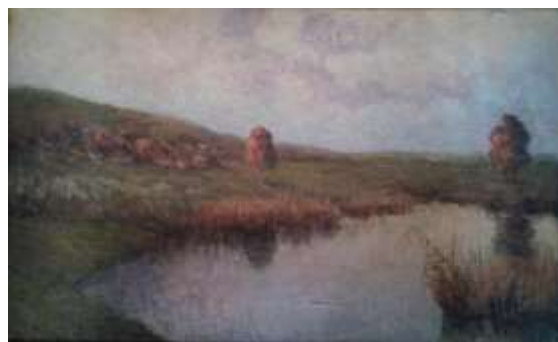
Рис. 2. М. Бездільний. Вечірня тиша. 1975. Полотно, темпера. 45,5x71. Тернопільський обласний художній музей.

Поряд із такими класичними прийомами є елементи, виконані на власний розсуд. Це трактування дерев на передньому плані – вони у деякій мірі плоскісні, з частково переданим об'ємом або взагалі без нього («Дощ іде», «Верби над річкою», «Зимовий вечір», «Стара верба») (Рис. 3). Досить складно відповісти на запитання, чим же керувався автор, що він шукав, чим це збагачувало його картини. Можливо, це частково площинне вирішення стовбурів дерев та гілок створює певну композиційну схему, яка неначе замикає, «стримує» країни полотна і зосереджує увагу в центрі. Деревина відіграють свою роль у зображенні як вертикалі композиції, які чітко дають зрозуміти поділ композиції на небесну та земну частини.