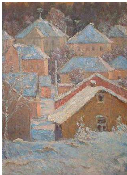
Рис. 5. М. Бездільний. Недільний ранок. 1970-ті.

слова: «не шукайте там світла, де воно на поверхні, шукайте там, де воно є як світло». У картині «Недільний ранок» чудово передано настрої сонячного ранку (Рис. 5). Структура роботи працює вертикально, геометрія будинків створює певний ритм подібних форм і можна вже не бачити потребу у багатьох загальноприйнятих професійних речах – тінях, перспективі. Художник передав нам піднесений настрої, затишок невеликого міста, холодний зимовий колорит, а не повчальні правила реалістичного зображення. В інших роботах ефект світла досягається активними теплими рудими плямами («На підвіконні», картини з оранжевими дахами будинків).