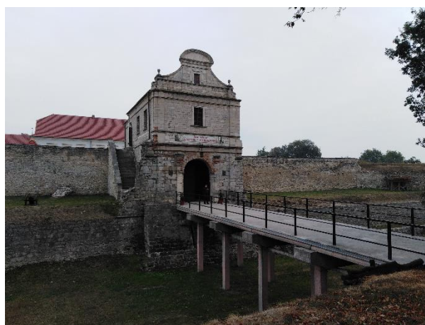
Рис. 1. Збараський замок