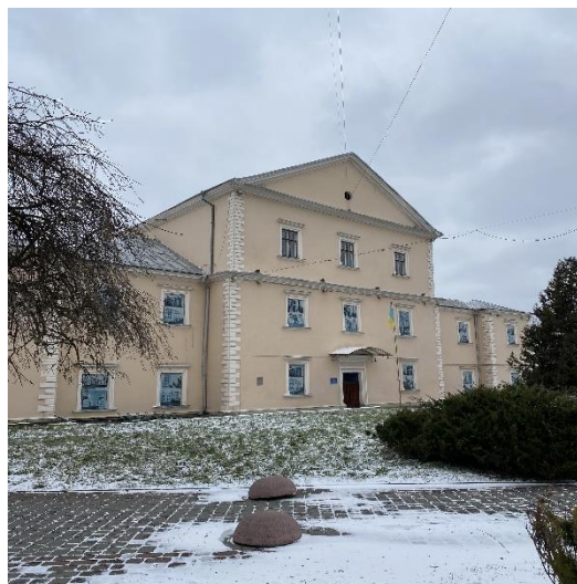
Рис. 2. Тернопільський замок.

Перший запис у біографії Тернополя – 15 квітня 1540 року – пов'язаний із королівським дозволом на спорудження замку над Серетом Краківському каштеляну Яну Тарновському. Ця фортифікаційна споруда мала перекрити шлях різним наїзникам на широких просторах від Теробовлі до Буська, де на той час не було жодного великого укріплення, хоча сама природа створила всі умови для цього. Сотні вправних ремісницьких рук почали зводити мурі нової фортеці, що мала стати