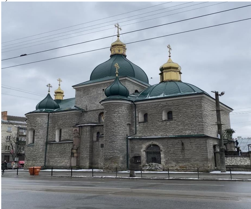
Рис. 4. Кафедральний собор Різдва Христового.

Неподалік універмагу знаходиться ще одна старовинна споруда – Кафедральний собор Різдва Христового (рис. 4).