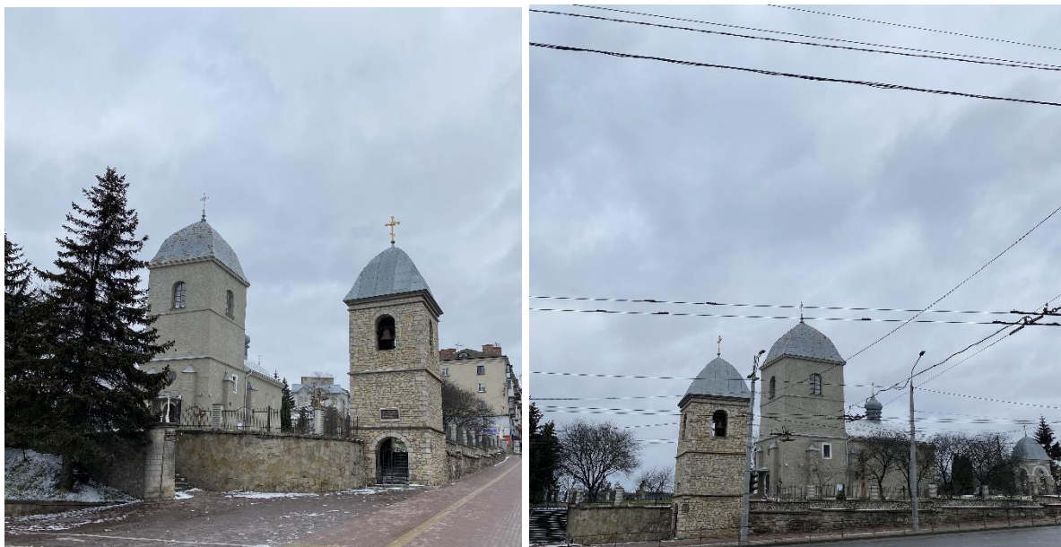
Рис. 1. Церква Воздвиження Чесного Хреста

Одним із таких об'єктів є Церква Воздвиження Чесного Хреста (Надставна, Здвиженська) (рис. 1). Це найдавніша споруда у місті Тернопіль, яка розташована на невисокому пагорбі над водосховищем (ставом). Споруджена у кінці XVI століття і є пам'яткою архітектури національного значення.