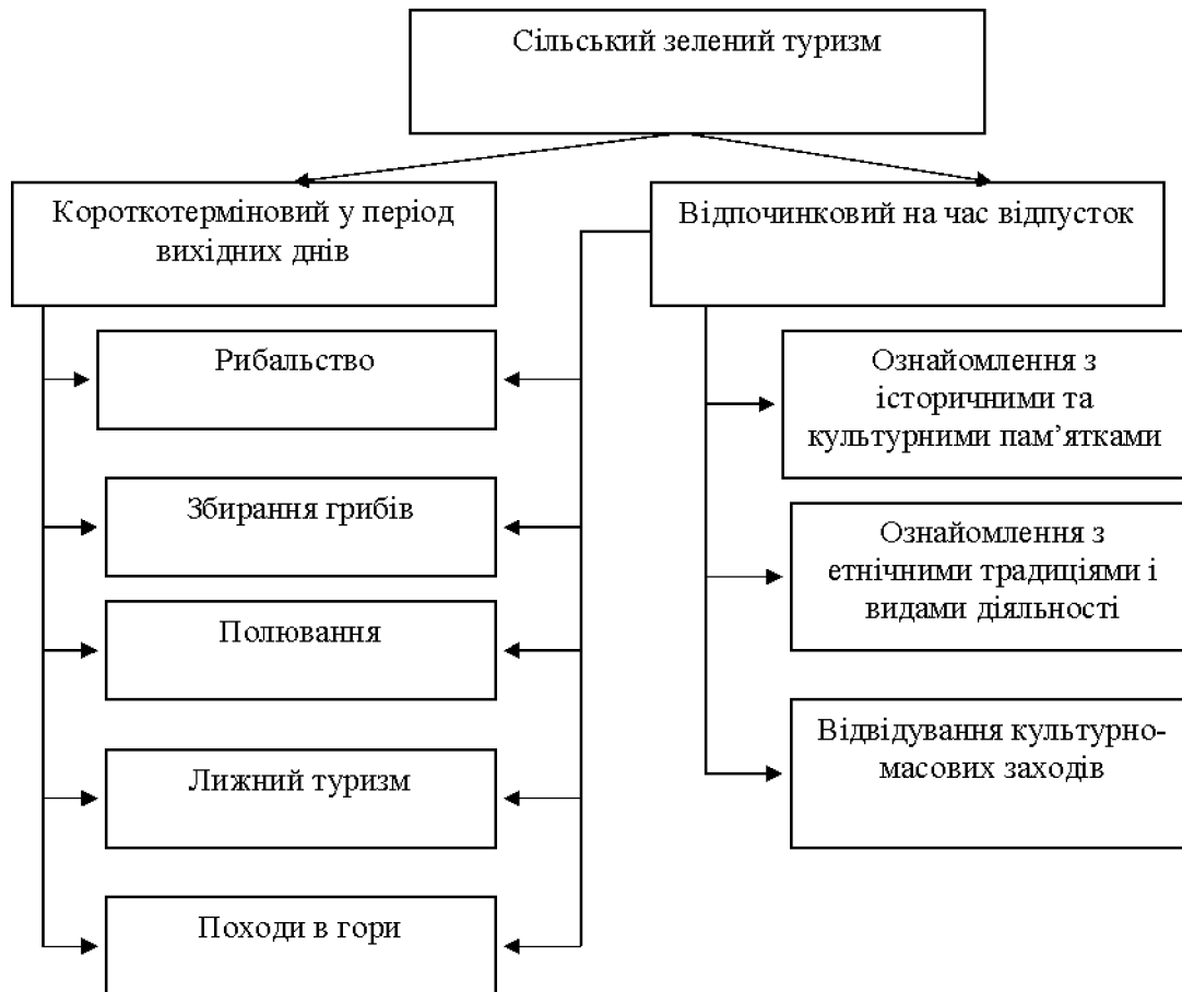
Рис. 2. Структура сільського зеленого туризму.

підприємницької діяльності та надають послуги з тимчасового проживання туристів у власному житловому будинку сільського господаря, в окремому будинку або на території особистого селянського господарства;