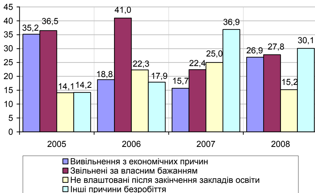
Безробітні за методологією МОП за причинами незайнятості у 2005–2008 роках в Івано-Франківській області (у віці 15–70 років; у %)

Альтернативою запобігання безробіття є підвищення кваліфікації кадрів. У 2008 р. в Івано-Франківській області 3112 осіб навчались новим професіям, однак це всього 1,2 % від кількості штатних працівників. Більшість населення набувала знань за професіями у галузі промисловості (69,4 %). Також у 2008 р. зросла кількість осіб, що підвищили свою кваліфікацію: у Івано-Франківській області їх було 21385 осіб. Найчастіше населення підвищувало свою кваліфікацію в таких сферах як освіта (29,2 %), промисловість (25,7 %), охорона здоров'я, надання соціальної допомоги (19,2 %), транспорт (9,6 %). Перекваліфікацію на інші професії здійснюють переважно мешканці міської місцевості. Це пов'язано здебільшого із доступним розташуванням послуг даних організацій.