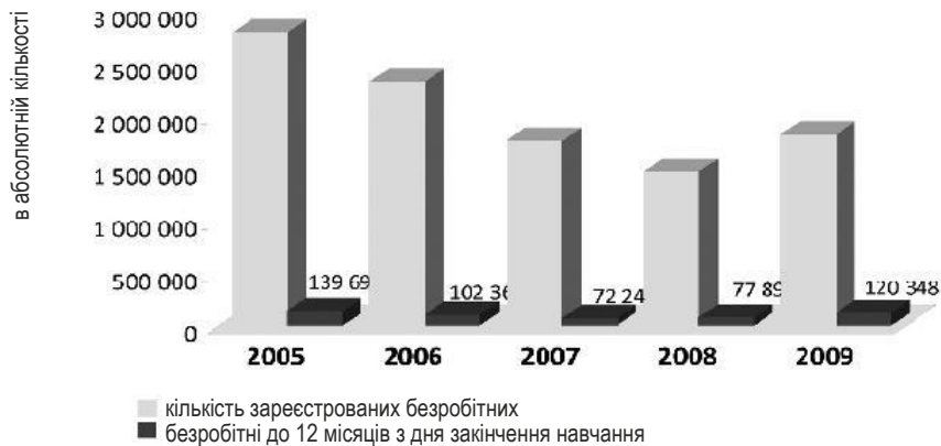
Рис. 1. Кількість зареєстрованих безробітних загалом та до 12 місяців з дня закінчення навчання у Польщі (станом на кінець 2010 р.).

Як видно з табл. 1, нині у найважчій ситуації є випускники основних професійних шкіл. Низький рівень кваліфікації, здобуття професії, непристосованість до потреб ринку праці значно збільшили рівень безробіття (49,3% в 2009 р.) і релятивно низький ступінь працевлаштування (42,5%). Несприятлива ситуація на ринку праці випускників основних професійних шкіл зумовила зменшення кількості осіб, що навчаються в цих школах. У результаті кількість випускників зменшилася з 238,1 тис. у 1990/91 навчальному році до 67,4 тис. у 2007/08 навчальному році (GUS, 2000; 2009a).