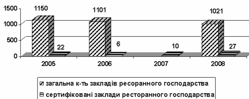
Рис. 2. Результати сертифікації послуг харчування у Волинській області.

До вагомих стримуючих факторів щодо отримання сертифікату відповідності є застаріла матеріальна база закладів ресторанного господарства, яка не відповідає сучасним вимогам стандартів та попиту споживачів для задоволення їх потреб, відсутність впливу з боку органів влади і звісно саме бажання власників закладів ресторанного господарства, так як примусити провести сертифікацію орган сам невзможі.