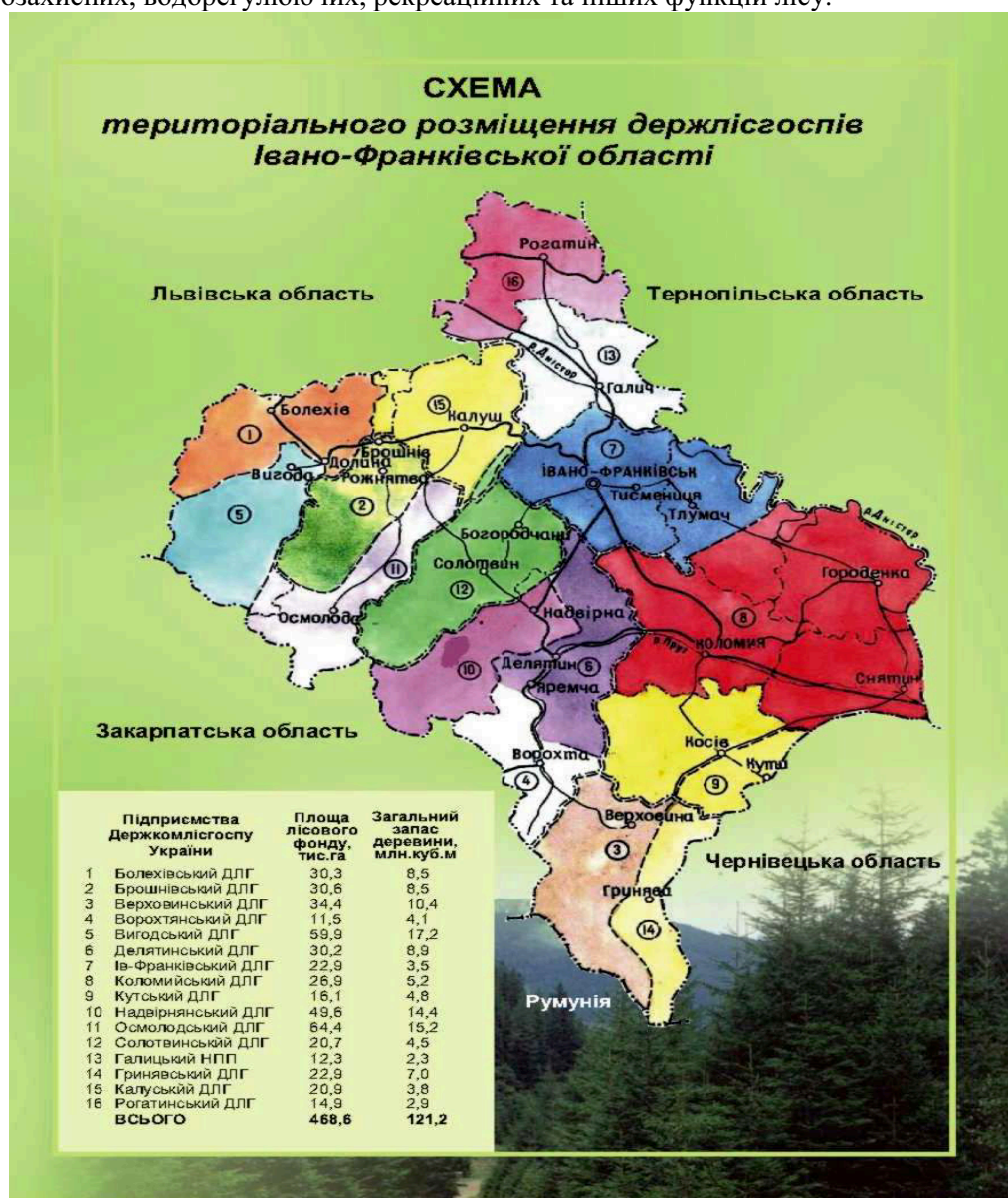
Рис.1. ( організаційна структура) [3].

Одним із головним завдань є створення та відновлення лісів з метою підвищення продуктивності та біологічної стійкості насаджень, покращення їх якісного складу, посилення ґрунтозахисних, водорегулюючих, рекреаційних та інших функцій лісу.