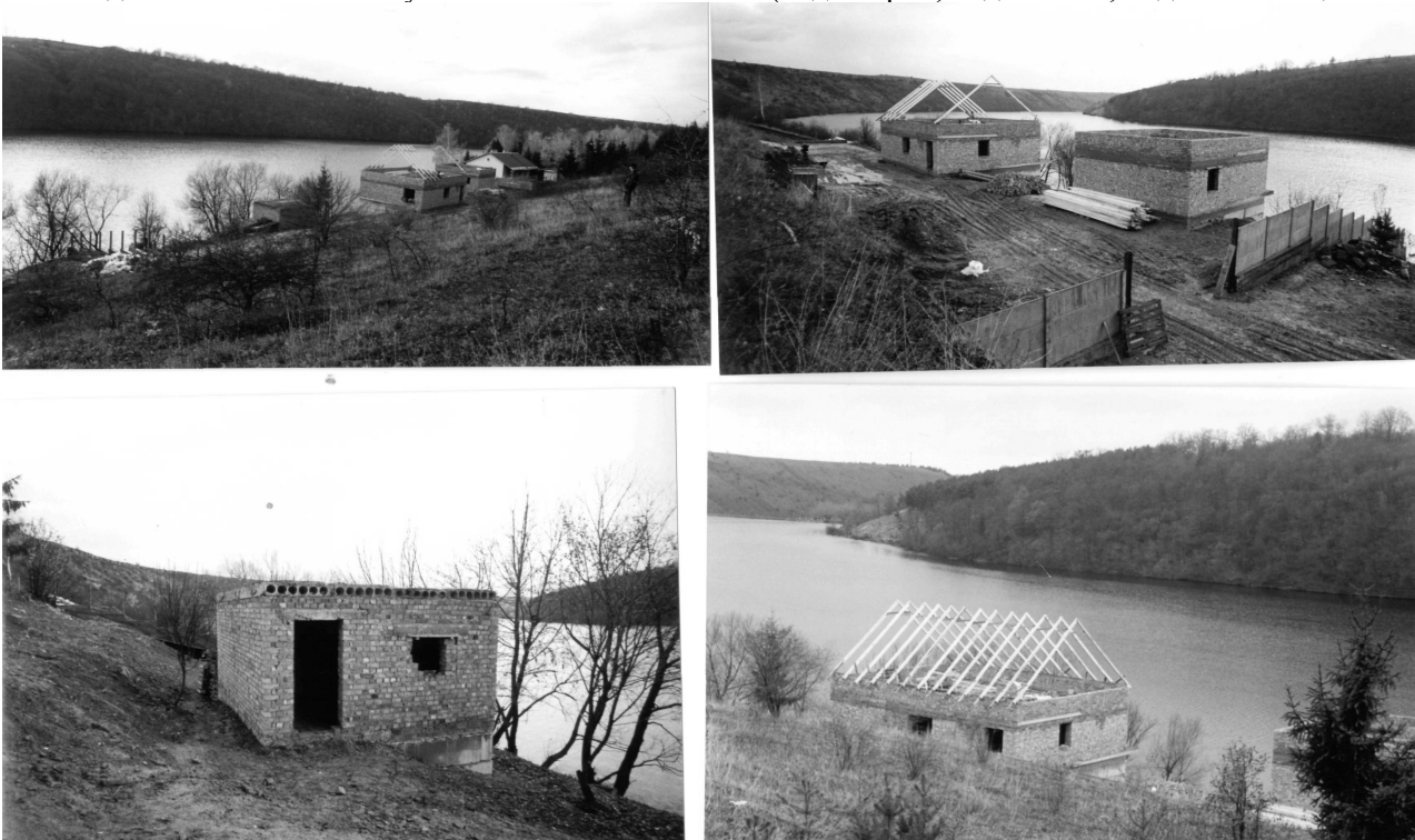
Рис.1. Несанкціонована забудова на території ландшафтного заказника в околиці турбази "Росинка"

Одночасно рекреаційні заклади можуть прийняти декілька сотень рекреантів. До послуг приїжджих автостоянки, водні атракціони (водні гірки, водні лижи, лодочна станція з