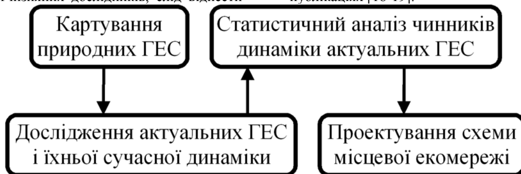
Рис. 1. Етапи дослідження динаміки актуальних ГЕС

Виклад основного матеріалу. Спочатку коротко розглянемо дослідження, для якого будувалася вищезгадана модель. Отже, проведене дослідження складається із кількох послідовних етапів, кожен наступний з яких базується на результатах попередніх (рис. 1). Першочергово в його рамках закартовано структуру природних і актуальних ГЕС територій п'яти модельних сілрад, розташованих у гірських та передгірських районах Львівщини. Після з'ясування динаміки актуальних ГЕС проведено статистичний аналіз її чинників. Також дані про актуальні ГЕС та їхню динаміку враховано при проектуванні схеми місцевої екомережі. Детальніше методика та результати цих етапів дослідження викладено у окремих публікаціях [18-19].