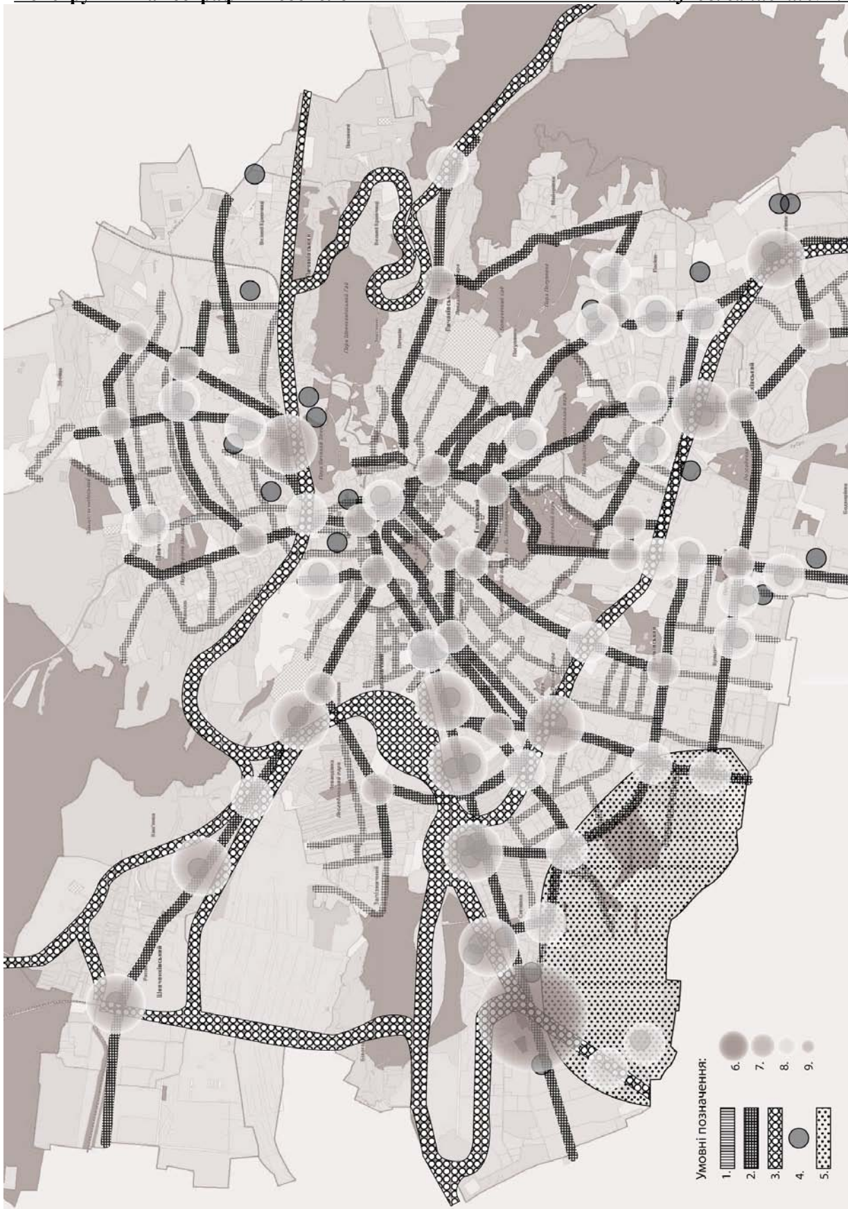
Рис. 5 Картосхема урбоекосистеми Львова з геосистемами та центрами акустичного навантаження