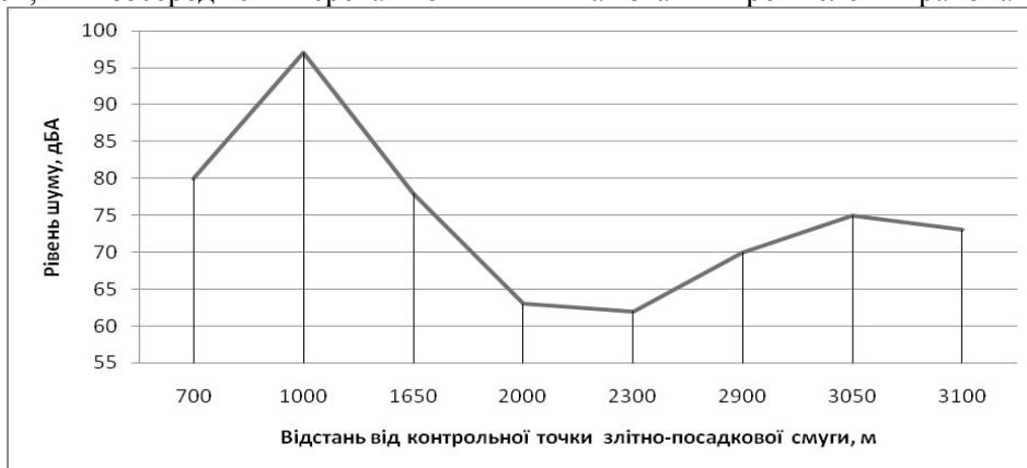
Рис. 3 Діаграма просторового поширення акустичного навантаження від авіаційного транспорту

Шум, утворений діяльністю підприємств хоча й характеризується значними показниками (понад 80 дБА) в межах цехів, практично відсутній поза промисловою територією. Як видно з рис. 4, промисловий шум спадає прак-