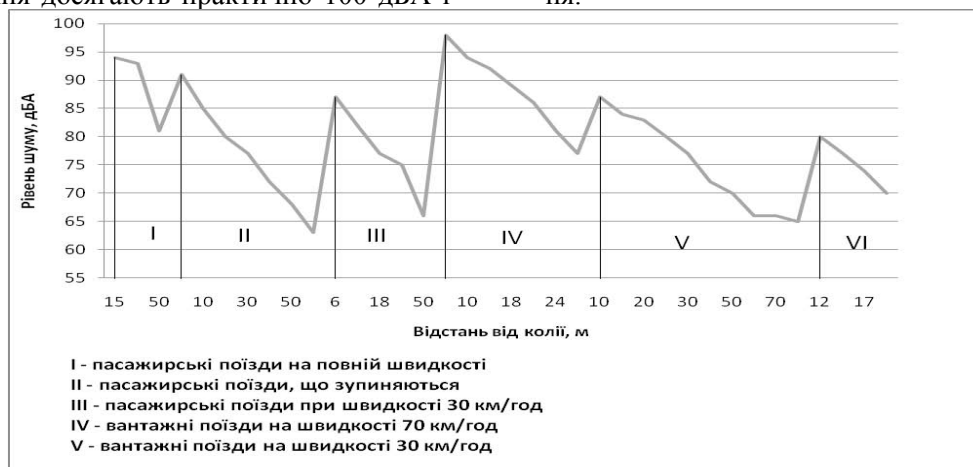
Рис. 2 Діаграма просторового поширення акустичного навантаження від залізничного транспорту

повільно та, водночас, нерівномірно спадають віддаляючись від колії. Рівні шуму утворені діяльністю поїздів на різних етапах функціонування на відстані 50 м від колії коливаються від 82 до 64 дБА. Внаслідок будова таких шумових урбоекосистем буде відзначатися значною центральною ділянкою, яку характеризують високі рівні акустичного навантаження.