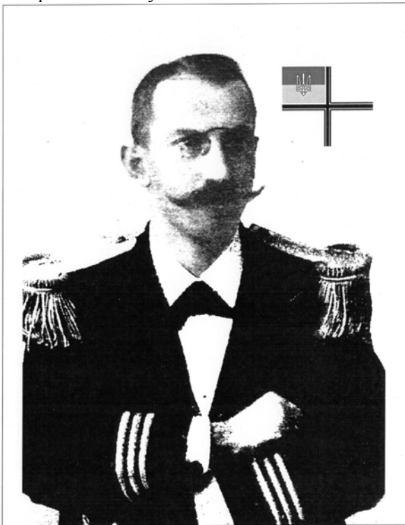
Ярослав Окуневський "Адмірал"

Постановка проблеми у загальному вигляді. Україна дала світу багато талановитих вчених у різних галузях знань, в тому числі і військових спеціалістів високого рангу. На жаль, у зв'язку з тривалою відсутністю власної державності, багатьом з них довелося працювати на чужині, імена їх замовчувалися або не асоціювалися з українською нацією, їх вважали росіянами, австрійцями, чи поляками, в залежності від того, яким державам та імперіям вони служили.