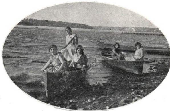
Рис. 1. Відпочивальники на пляжі “Сонячний” та біля човнової станції Т-ва веслувальників