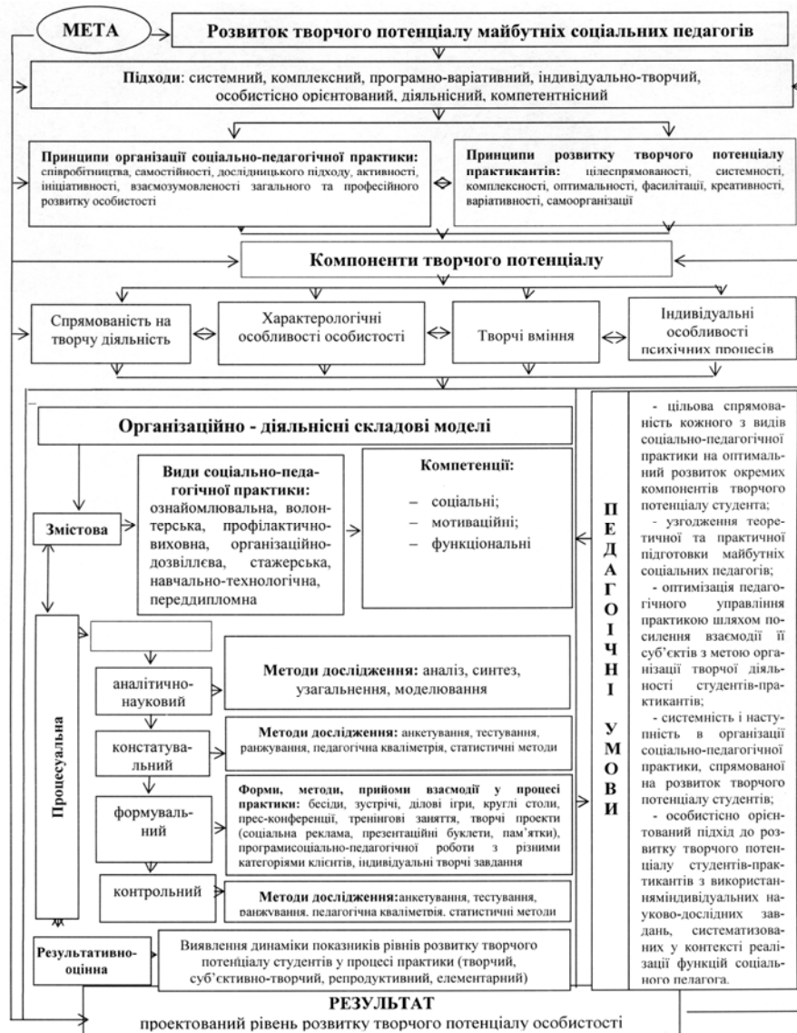
Рис. 2. Модель розвитку творчого потенціалу майбутніх соціальних педагогів у процесі соціально-педагогічної практики

Дослідно-експериментальна робота передбачала визначення та реалізацію педагогічних умов розвитку творчого потенціалу майбутніх соціальних педагогів у процесі соціально-педагогічної практики. Педагогічні умови є органічним компонентом структурно-функціональної моделі розвитку творчого потенціалу майбутніх соціальних педагогів у процесі соціально-педагогічної практики, що виражає цілісний процес його розвитку, охоплює мету, підходи, принципи реалізації, змістову, процесуальну та результативно-оцінну складові (рис. 2).