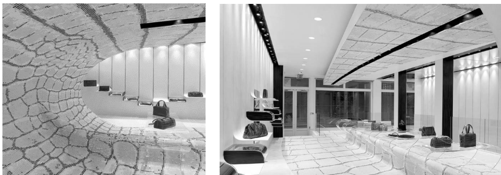
Рис.1. Бутик Tardini, Нью-Йорк, 2000, диз. Фабіо Новембре