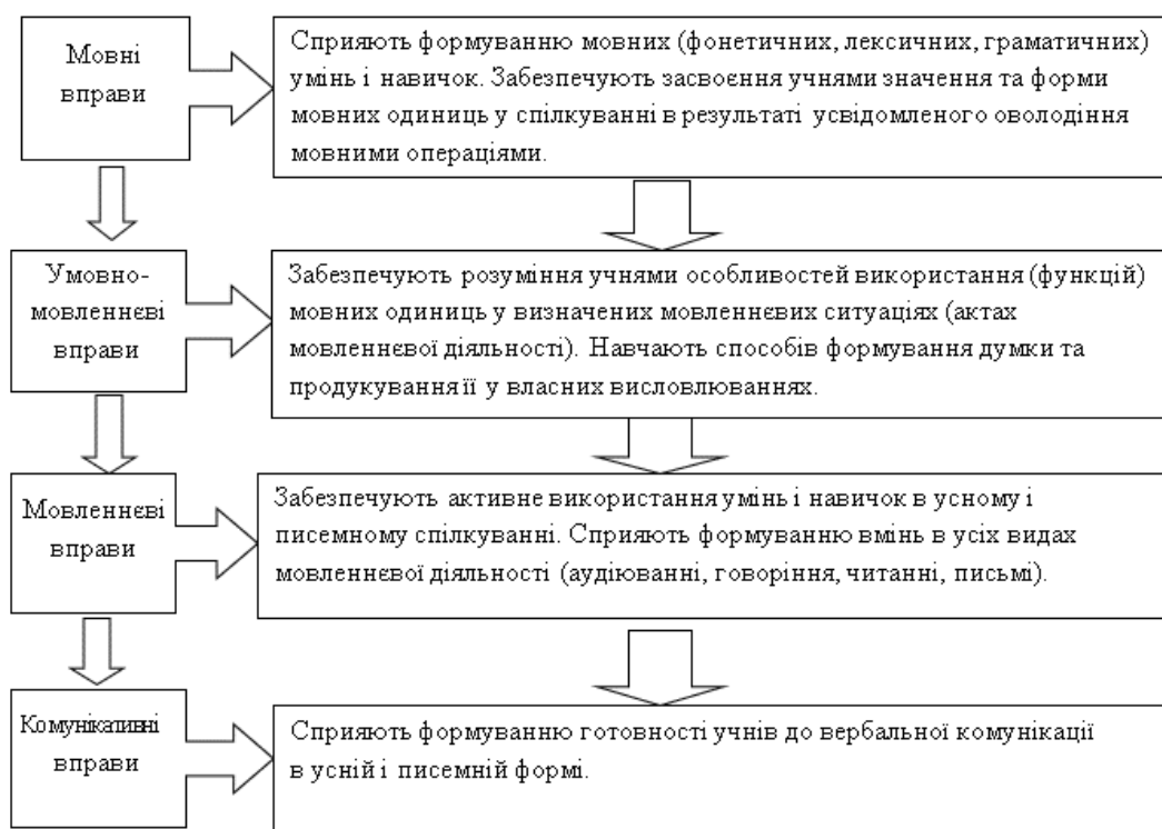
Рис. 1. Послідовність і функції вправ як засобу оволодіння мовною, мовленнєвою і комунікативною компетентністю

Навчання української мови з метою формування комунікативної компетентності учнів загальноосвітньої школи відбувається за допомогою тренування, результативність і успішність якого безпосередньо залежить від науково-обґрунтованої системи практичних завдань і вправ. Вправи широко використовують у практиці і, безумовно, є цінними для розвитку репродуктивної та продуктивної мовленнєвої діяльності учнів, оскільки наближають навчання до вирішення життєвих потреб, дозволяють учителеві активізувати навчально-виховний процес, а учням набути потрібних знань і виробити вміння та навички шляхом практичної діяльності.