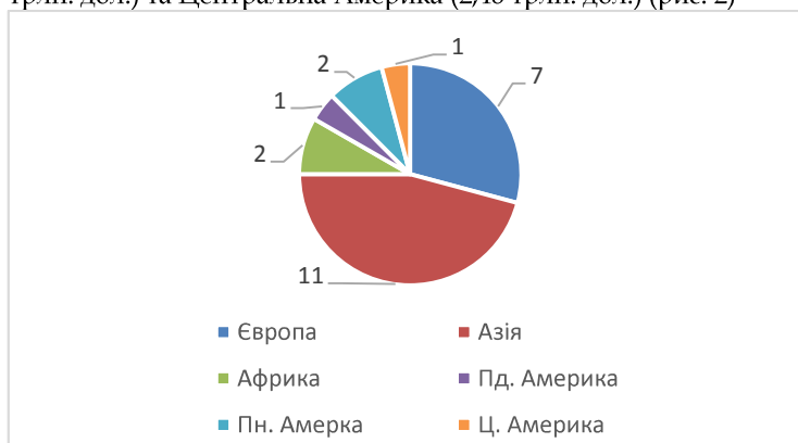
Рис. 2 Регіональний розподіл ВВП, країн

Однак, основними ядрами зростання виступають економічно розвинені країни з потужними економіками, зокрема Китай, США, Індія, Японія та інші, загалом їх нараховується 25. На їх частку припадає 96,33% від світового ВВП. В регіональному відношенні з них 11 країн знаходяться в Азії, їх сумарний ВВП становить 54,33 трлн. дол., 7 країн – в Європі (сумарний ВВП – 17,39 трлн. дол.), 2 країни – в Північній Америці (21,26 трлн. дол.), 2 країни в Африці (2,33 трлн. дол.), по одній країні в таких регіонах як Австралія (1,25 трлн. дол.), Пд. Америка (3,25 трлн. дол.) та Центральна Америка (2,46 трлн. дол.) (рис. 2)