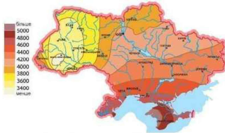
Рис. 2. Сумарна сонячна радіація (МДж/м 2 ). Рік [2]

Найменші значення за рік спостерігаються в Українських Карпатах (Міжгір'я - 3250 МДж/м 2 ), що зумовлено послабленням сумарної радіації влітку, коли тут інтенсивно розвивається хмарність (рис. 2).