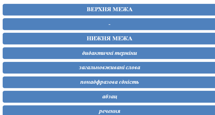
Схема 3. Навчальний текст

Що стосується навчального тексту , тобто такого, що виступає дидактичним засобом у навчальному процесі, то він має свою сферу дослідження (схема 3).