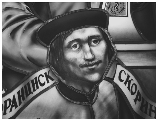
Іл.2. Фрагмент вітража (розпис, свинцева спайка)