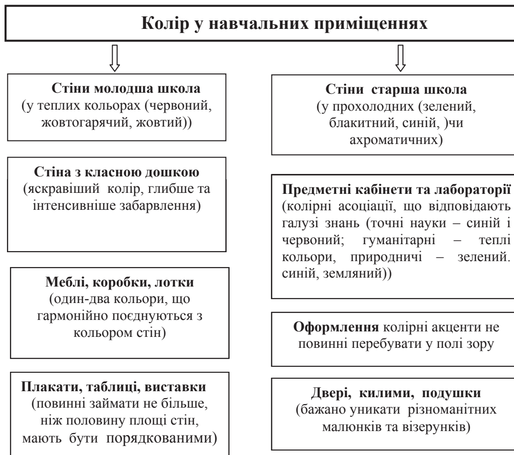
Рис. 2. Колір у навчальних приміщеннях

Найпомітніший та найвагоміший чинник художнього рішення класу – колір. Він створює емоційну атмосферу, моделює настрій, сприяє навчальній діяльності чи, навпаки, заважає та демотивує.