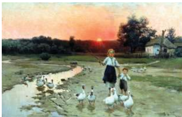
Іл. 4. М.К. Пимоненко

«Вечоріє» (4) Такі роботи, як: «Брід» (іл.3), «Вечоріє» (іл.4), «Жнива в Україні», «По воду», «Гуси, до дому», «Весілля в Україні», «Дівчина з граблями», «Молодиця» та багато інших полотен, передають атмосферу надуману митцем, завдяки введенню в композицію багатоплановості, яка зображена на задньому фоні, але не є менш важливішою за сюжет, який зображений на першому плані.