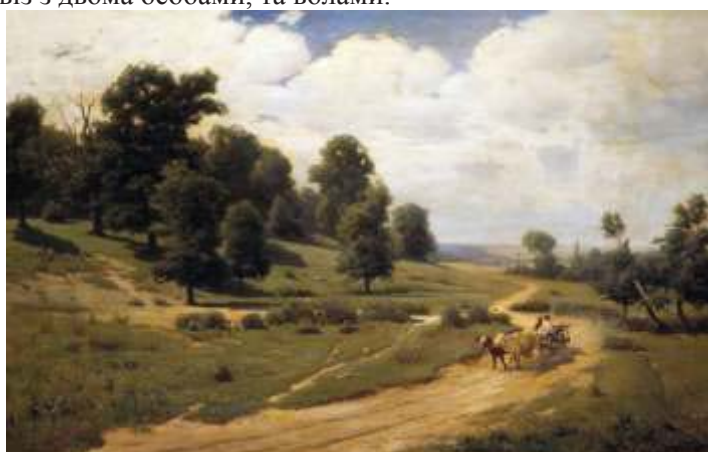
Іл. 2. С.І. Васильківський «Український пейзаж» (2)

В епічному або в просторовому пейзажі головну роль відіграє багатоплановість, що дає змогу передати великі простори навколишнього середовища. На полотнах, де зображений епічний пейзаж мусить бути не менше чотирьох планів, які будуть передавати враження повітряної перспективи, багатоплановість простору. Також невід'ємним елементом епічного, або просторового пейзажу, є елемент присутності людини. Це можуть бути невеликі фігури людей, на дальніх планах композиції картини. Невеличкі будівлі, які не конкурують з дальнім планом, а є вписаним елементом композиції твору. Наприклад, в творчому наробітку українського художника Васильківського Сергія Івановича є ряд живописних полотен, де досить майстерно зображено буття сільського народу України XIX – XX ст. Наприклад, на полотні «Український пейзаж» (іл.2) можемо споглядати елемент просторового пейзажу, який виражений в багатоплановості простору, і де на перших планах, хоча і не відіграє головну роль, показаний елемент, який відноситься до епічного пейзажу, а саме елемент буття людини. В даному випадку, це віз з двома особами, та волами.