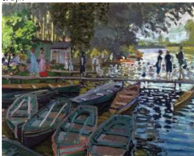
Іл. 1. К. Моне «Жабник» (1)

стану і тісно пов'язане з художнім значенням тексту з його семантико стилістичною структурою в цілому. [5, с. 8]».