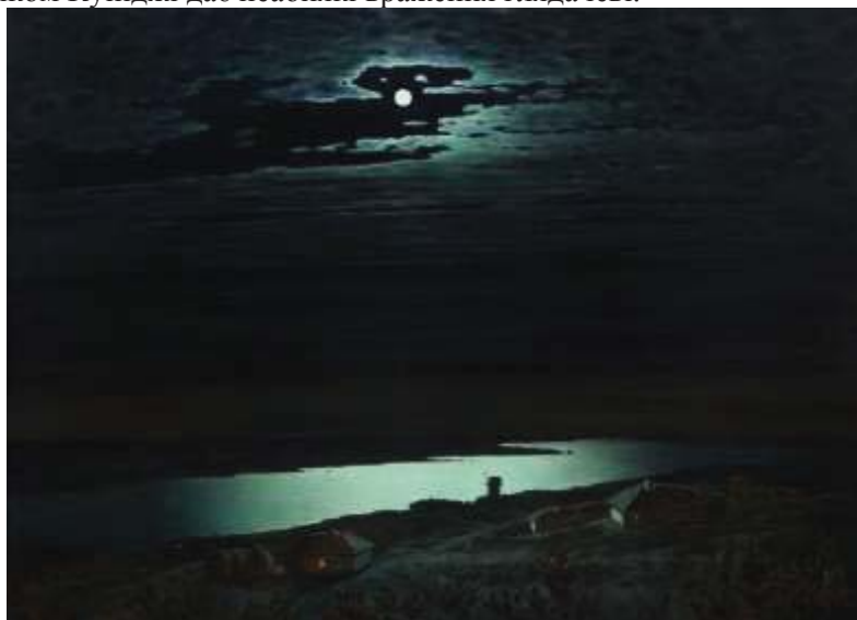
Іл. 6. А.І. Куїнджі «Місячна ніч на Дніпрі»(6)

Художник майстерно передав природне явище, завдяки колористиці природного стану, який споглядав Архип Куїнджі, та контрасту кольорів переднього плану, який знаходиться в тіні хмар та яскравого сонячного світла який відбивається на задньому плані композиції картини. Не можна не згадати ще одну роботу майстра. А саме, картину «Місячна ніч на Дніпрі» (Іл. 6.)1880-го року. На полотні зображено нічну пору, головним елементом якої відіграє яскравий повний місяць, що відбивається в водах Дніпра. Даний сюжет, та його виконання художником Куїнджі дає неабиякі враження глядачеві.