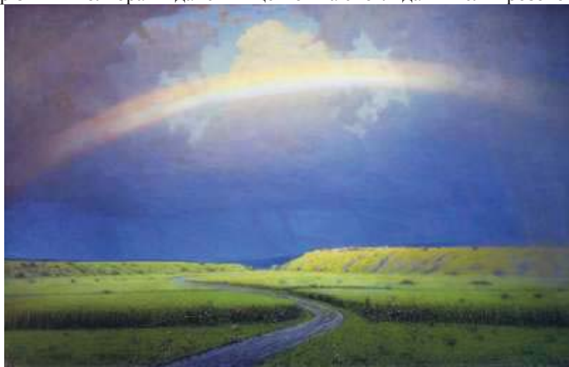
Іл. 5. А.І. Куїнджі «Веселка» (5)

метеорологічного стану довкілля, який виражений в природному явищі, який називають веселкою, сяйво з різними кольорами дане явище можна споглядати після грозового дощу.