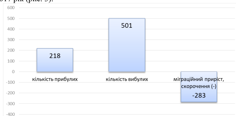
Рис. 3. Міграційний рух населення в Бучацькому районі у 2017 році [4]

Сучасні міграції, це ще один демографічний показник населення, що має соціально-економічні причини. Щороку певна кількість працездатного населення виїжджає з району на заробітки, деяка частина повертається назад. В середньому ці показники можна розглядати за 2017 рік (рис. 3).