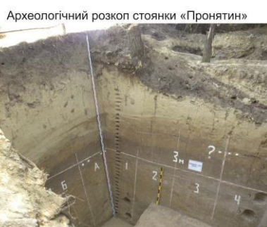
Рис. 1. Археологічні пам'ятки на території Тернопільського району

В мезоліті природні умови змінюються у зв'язку з пом'якшенням клімату. Провідною корисною копалиною залишається кремій. Проте поселень мезоліту в межах регіону виявлено всього 5 і головна причина