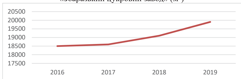
Рис. 2. Динаміка затрат підземних вод на ТОВ «Збараський цукровий завод» (м³)

Темпи зростання як підземних так і поверхневих вод починаючи з 2016р. зростають, що пояснюються збільшенням